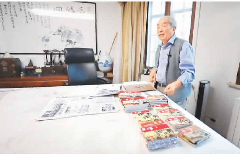
《红日》的过程。短视频《连环画里的党史》截图

连环画集绘画、故事一身，拥有广大的读者群，已经成为几代人的记忆。上海是中国连环画的发祥地，早在上世纪20年代就出版了各类“连环图画”，新中国成立后，上海人民美术出版社成为连环画创作重地，出版了大量反映中国共产党革命题材和军事斗争题材的连环画。中央广播电视总台视听新媒体中心与上海总站共同策划推出的这一系列短视频节目，讲述了脍炙人口的连环画中的党史故事、党史人物，向中国共产党成立100周年献礼。