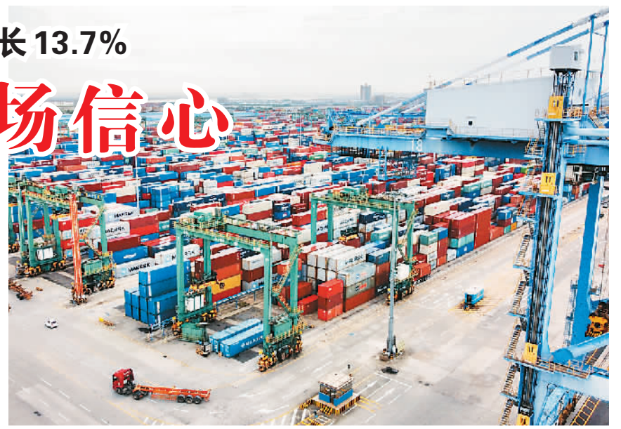
近年来,广东省广州南沙港加强基础设施建设,逐步打造成南方重要的物流配送基地。2020年南沙跨境电商网购保税进口额达188.2亿元人民币,占全国业务量的五分之一。图为广州港南沙港区码头堆场。

据广州市发展改革委副主任陈旭介绍,到2025年,全市地区生产总值将达3.5万亿元,研发经费支出占比将