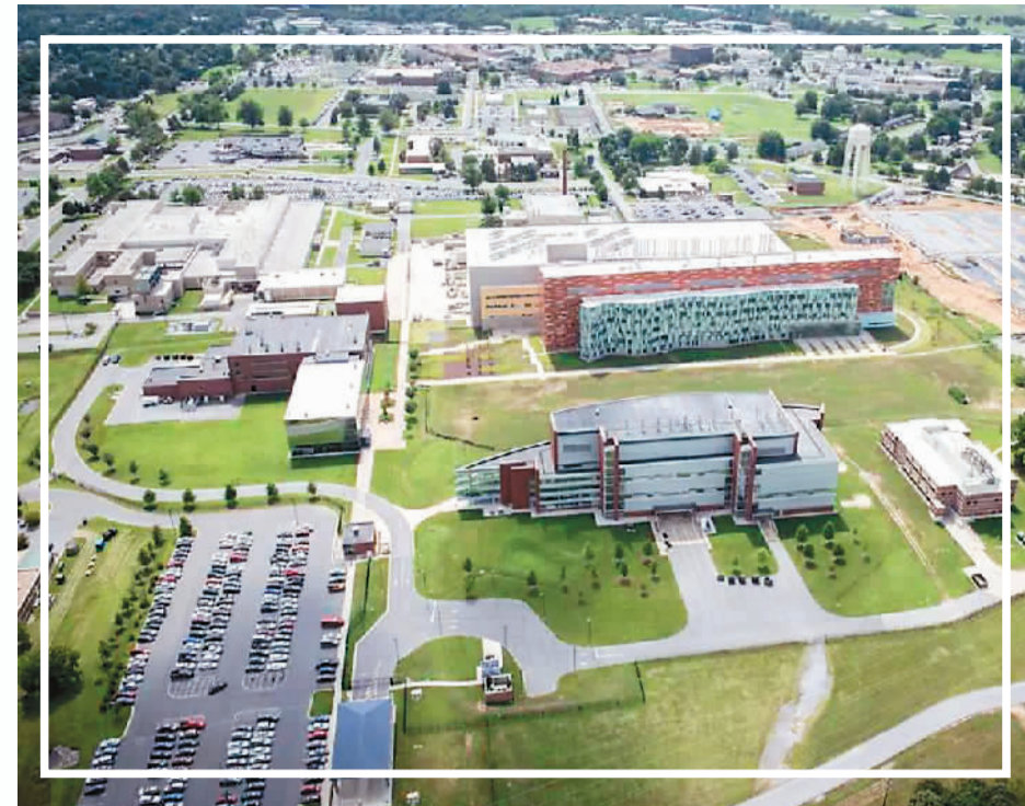
位于美国马里兰州的德特里克堡生物实验室。

密？美国政府为何对德堡种种漏洞遮遮掩掩，讳莫如深？美国民众对德堡的质疑何时能获得官方回应？国际社会对美国生化武器研究的批评何时能得到美国正视？新冠病毒溯源，不查德堡，难以服众！