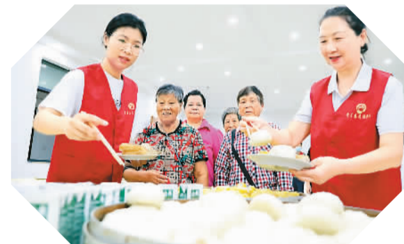
7月26日上午,浙江省杭州市桐庐县富春江镇龙湾宾馆汛期安置点,党员志愿者为转移人员分发包子、牛奶、鸡蛋、油条等早餐。