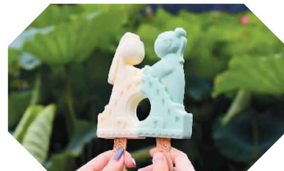
7月14日,在浙江杭州北山街永水平台荷塘边,游客展示购买的“断桥相会”冰淇淋。