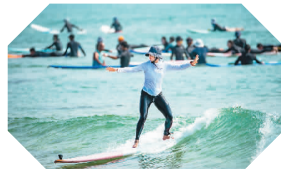
2月17日,海南万宁,游人在春光明媚的日月湾体验冲浪。