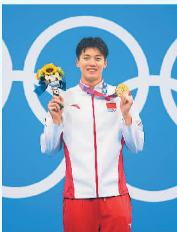
汪顺在颁奖仪式上。