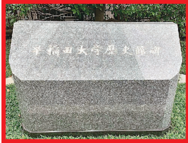
图为早稻田大学历史馆碑。

在日本早稻田大学知名学生名录中，李大钊、陈独秀等革命前辈的名字赫然在列，他们都在这里留下过学习与奋斗的青春足迹。留学奋斗期间的经历，为他们日后的革命思想埋下了种子。其中，谈到“中日友好邦交的桥梁”，有一个名字享有盛誉，那便是——廖承志。