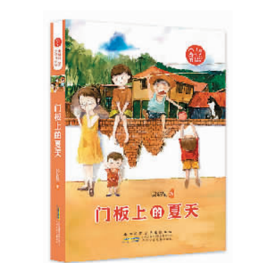
吴新星著 安徽少年儿童出版社出版

《门板上的夏天》最值得称道之处,就在于作者复活了田园生活中的儿童经验,并以此建构了一种游戏精神与劳动场景交融的诗性空间。在作者笔下,钓鱼抓虾、捕捉蟋蟀、骑牛逮鼠、偷枣藏柿……都是陈水小成长中靓丽的风景线,在对这些事件的描述中,陈水小调皮、机灵、聪颖的性