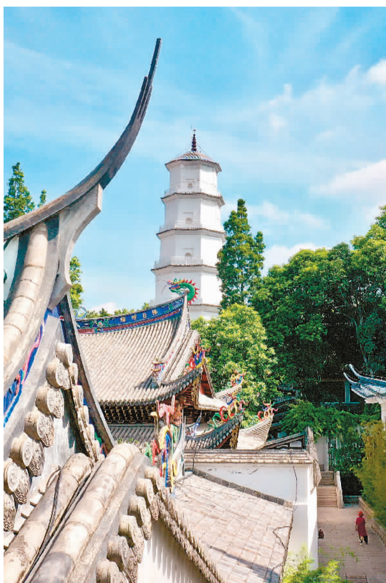
▼ 福州白塔和周围的景色。