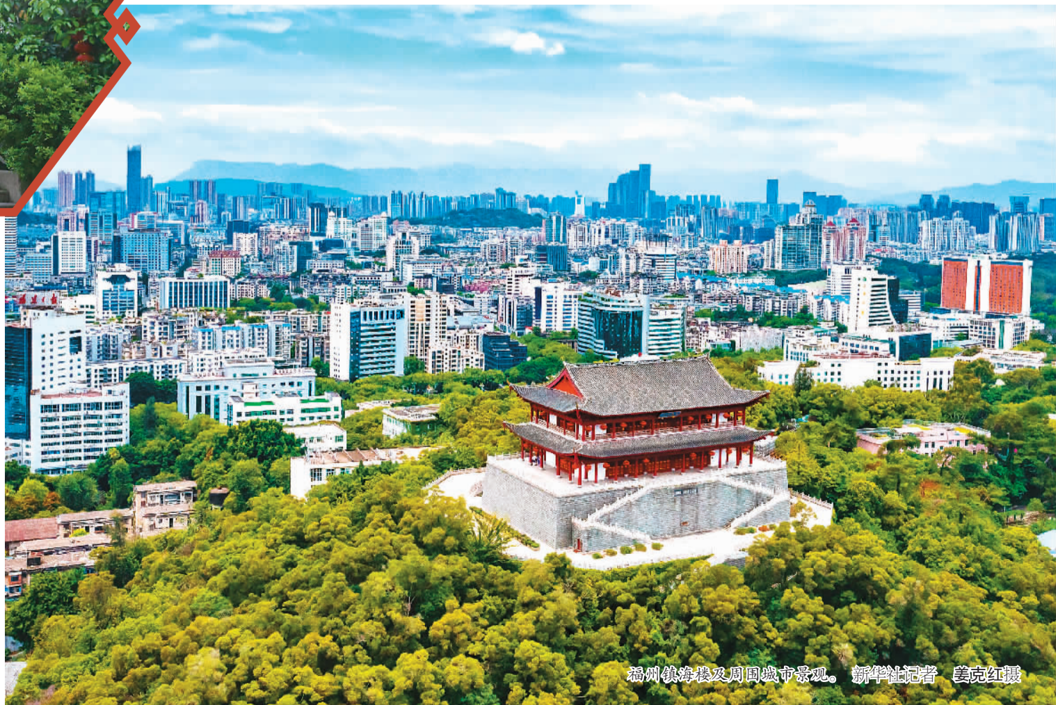
福州镇海楼及周围城市景观。