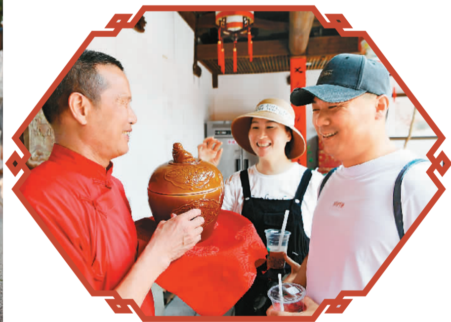
▲ 在位于福州三坊七巷历史文化街区文儒坊的一家闽菜馆里，工作人员（左）向来自浙江的游客介绍福州名菜佛跳墙。

这一组镜头，聚焦这座拥有2200多年建城史的国家历史文化名城，展现了这座城市的“世遗魅力”。