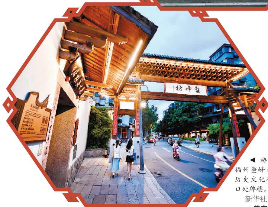
◀ 游客经过福州鳌峰坊特色历史文化街区入口处牌楼。