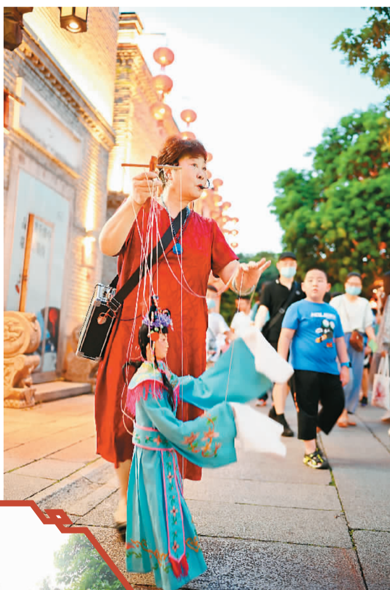
▲ 在福州三坊七巷历史文化街区南后街，艺人在进行提线木偶表演。