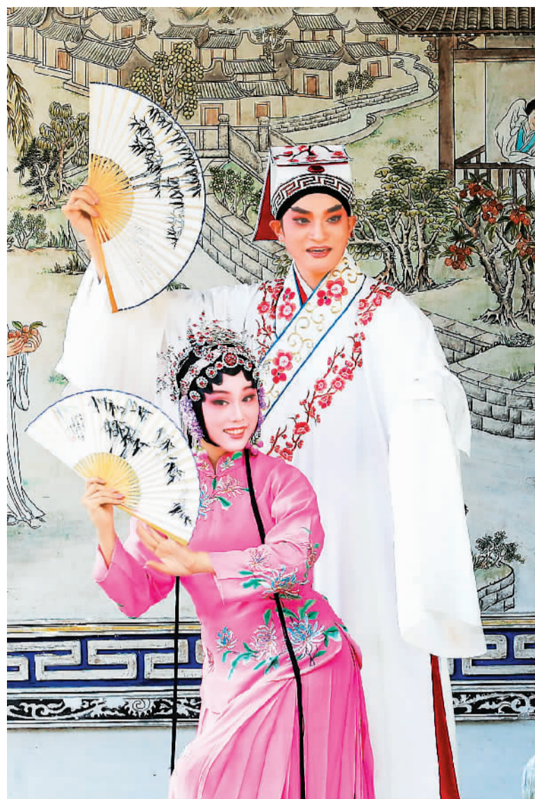
◀ 在福州市鼓楼区三坊七巷的水榭戏台内，演员进行福州国家级非遗项目闽剧演出展示。