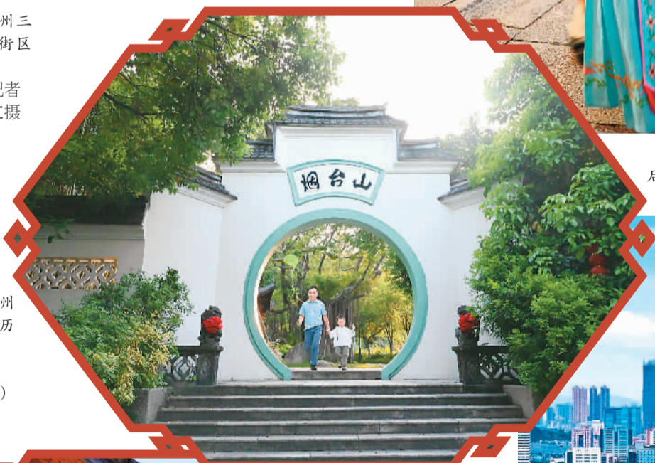
▶ 市民在福州市仓山区烟台山历史风貌区游览。