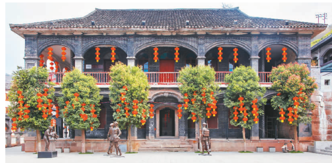
中国女红军纪念馆。

站在四渡赤水纪念馆的观景长廊，朝不远处山头上眺望，只见一块写有“土城渡口”四个鲜红大字的纪念碑威武耸立。86年前，红军就是从