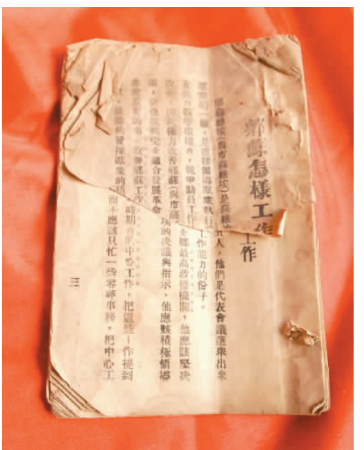
毛泽东、张闻天合著《区乡苏维埃怎样工作》。