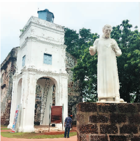
这是位于马来西亚马六甲城的圣保罗堂遗址。它因传教士圣方济各·沙勿略到此传教而成为海上丝绸之路的交流见证。如今堂前还立有沙勿略的雕像。