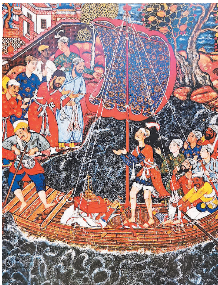
这幅绘制于1558年的图画，描述了海上丝绸之路沿线贸易往来、友好交流的场面。