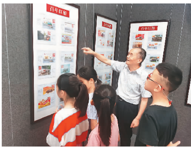
▲南湖区委档案馆工作人员为小学生讲述藏品背后的红色故事

南湖启航，行稳致远。南湖区在坚定红色文化自信的同时，还把更多时代音符融入其中，学思践悟、学史力行，让红色基因代代相传，为浙江高质量发展建设共同富裕示范区提供强大精神动力。