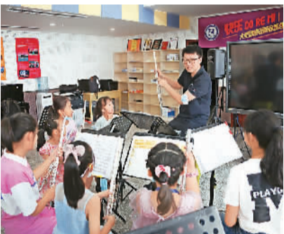
▲中国交响乐团文艺小分队在铁门关市的学校管乐团辅导