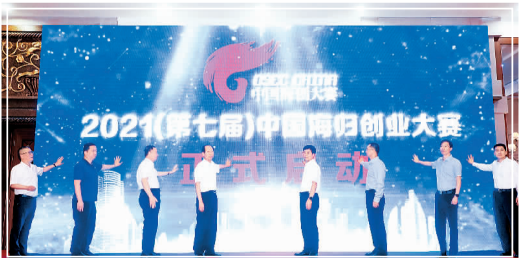
2021（第七届）中国海归创业大赛启动现场。