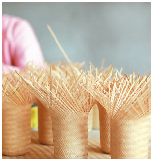
▼ 图为竹编产品展示。