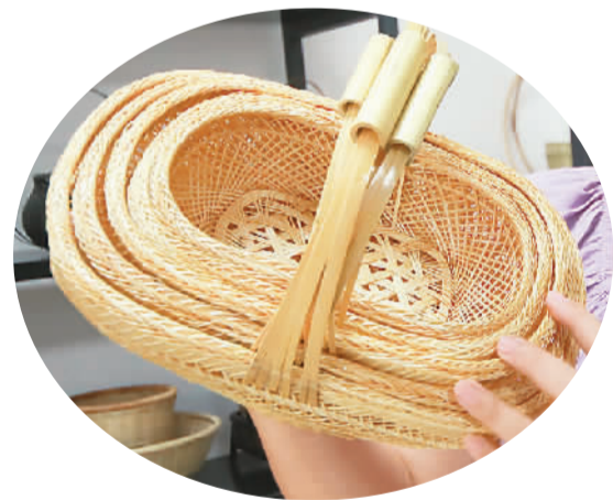
▲ 图为竹编制作的篮子。