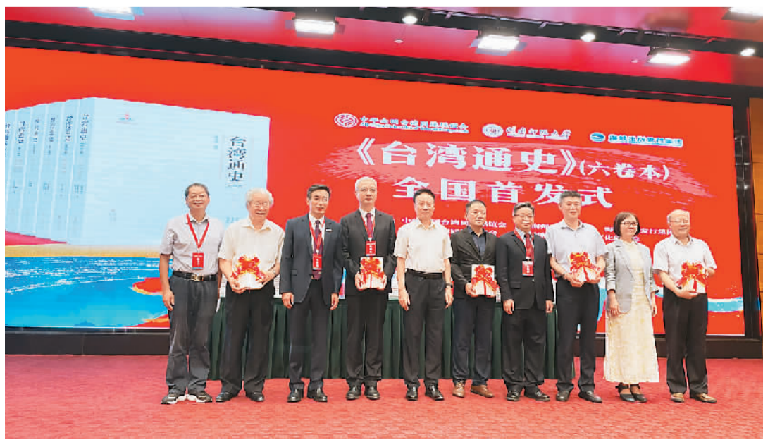
图为《台湾通史》(六卷本)首发式现场。

近年来,闽南师范大学精心做好闽南文化与两岸交流文章,重点推进闽南文化特色人才培养体系建设、闽南文化与两岸融合发展学术研究智库建设、闽台民间文化交流等工作,持续在增进两岸文化认同、服务两岸文化交流中发挥积极作用,先后编撰出版《台湾文献汇刊(60册)》《闽南涉台族谱汇编(100册)》和《台湾族谱汇编(80册)》等一批高水平成果。