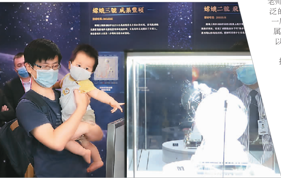
▲ 香港市民在香港会展中心一睹月壤真容。新华社记者 李 钢摄