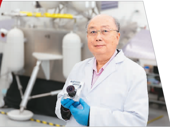
▲ 香港理工大学教授容启亮在展示由其团队研发的“火星相机”。“火星相机”搭载于“天问一号”着陆器外层平台，体重仅390克，但外壳坚固、稳定性高。(资料图片)