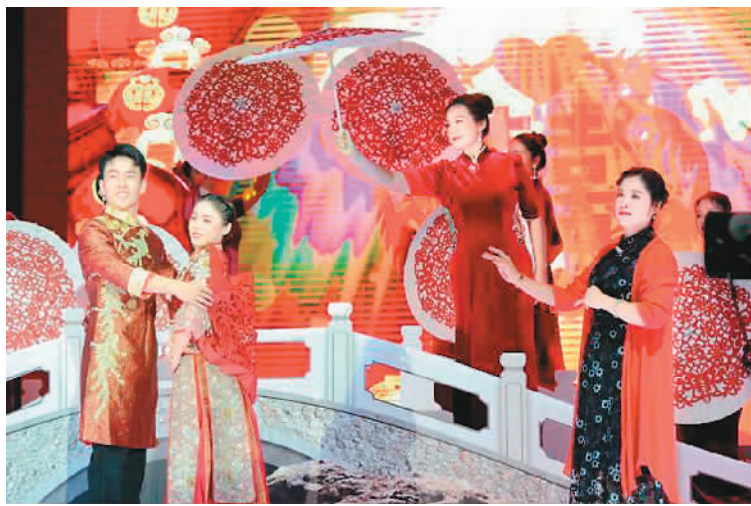
▲ 两岸同胞共演舞蹈《剪纸情缘》。

自2013年开始，福建省台联每年举办“同名村·心连心”联谊活动，活动主题常做长新，从“寻根”“续缘”“共建”到近年来的“食同味”“婚同俗”“居同厝”，台胞认同程度较高，有越来越多的台湾宗亲祖带孙、父携子一同参与进来，解乡愁、叙乡情，回到原乡寻根谒祖，“同名村”成了“同心村”。