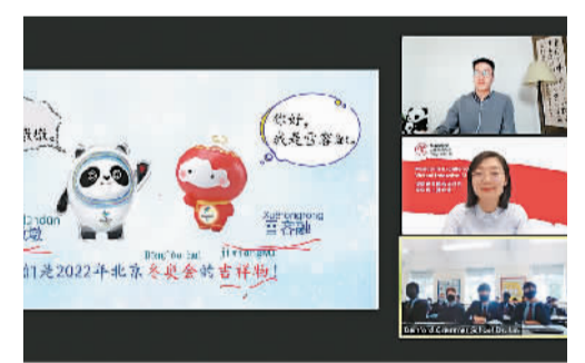
英国“中文培优”项目线上主题教学活动视频截图。

据悉，培优项目是由英国政府发起并出资支持，由英国文化教育协会、伦敦大学学院联合中国教育部中外语言交流合作中心主办，旨在培养优秀中文人才的项目。作为该项目的重要环节，每年英国培优项目中学生会在掌握一定中文基础后，参加访华夏令营进行集中研修。受新冠肺炎疫情影响，今年夏令营通过线上平台举办。