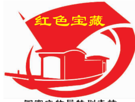
国家文物局特别支持