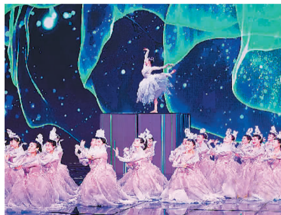
特别节目现场。

须“落地”，演员的表演、台词都力求真实，服化道等都要有生活质感。 统摄在“传承党员精神”这个命题之下，6个单元呈现了不同的叙事方式和美学风格：《美丽的你》温暖和谐，《腾飞》展现工业美学，《排爆精英》冷峻纪实，《因为有家》活泼生动，《紧急营救》紧张刺激，《幸福的处方》细腻动人。《腾飞》单元的导演徐纪周说，这一单元将工业设计设计与光影艺术结合，将电影美学融进电视剧制作，力争打造出史诗般的恢弘气势，充满科技气息，但本质上仍然是有设计感的现实主义风格。 《我们的新时代》以小切口反映大主题，小故事讲述大道理，小人物折射大时代。在这里，观众和剧中的青年主人公一起，“遇见时代，看见梦想，碰见生活”。