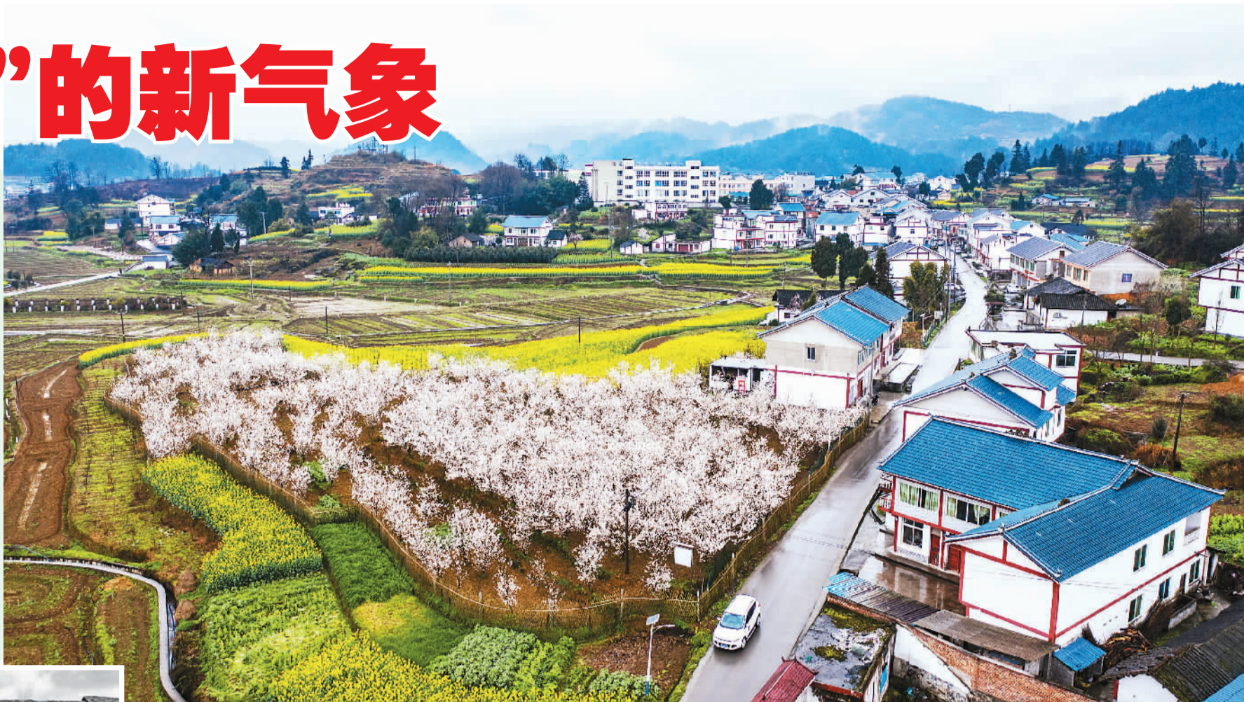
▲ 遵义市播州区枫香镇花茂村风貌。

如今，在遵义会议会址，游人如织；脱贫的村庄里，乡村产业发展如火如荼。这里是昔日中国革命的转折之地，也是中国乡村振兴的实践之处。这一组镜头，展现了遵义这一“转折之城”翻天覆地的历史巨变和发展新貌。