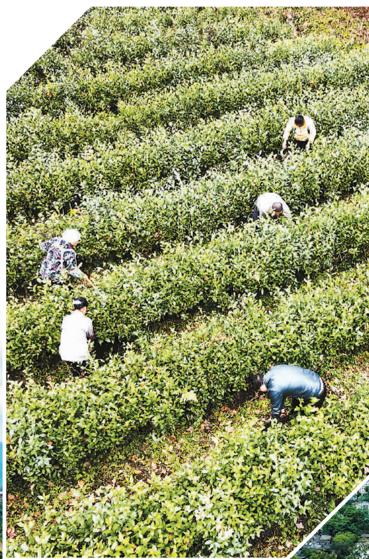
▲ 遵义市娄山春茶叶专业合作社的社员在茶园里劳作。