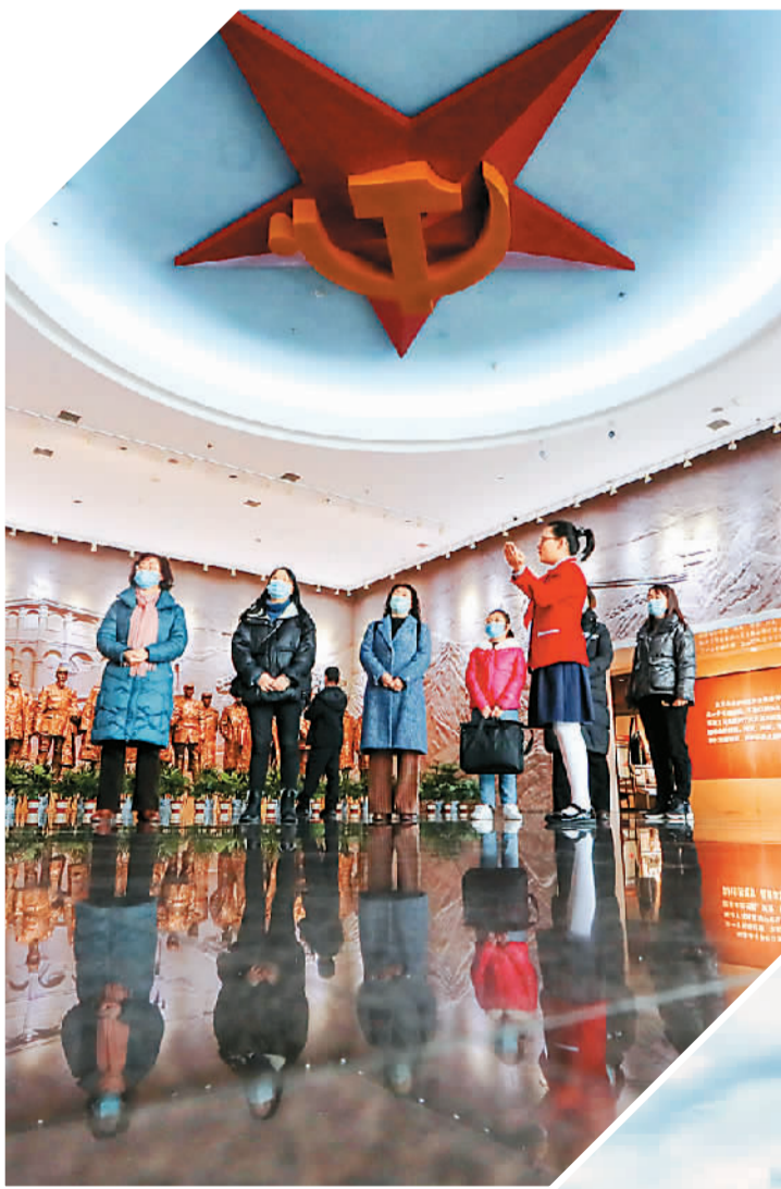
▲ 参观者在遵义会议纪念馆内听讲解。