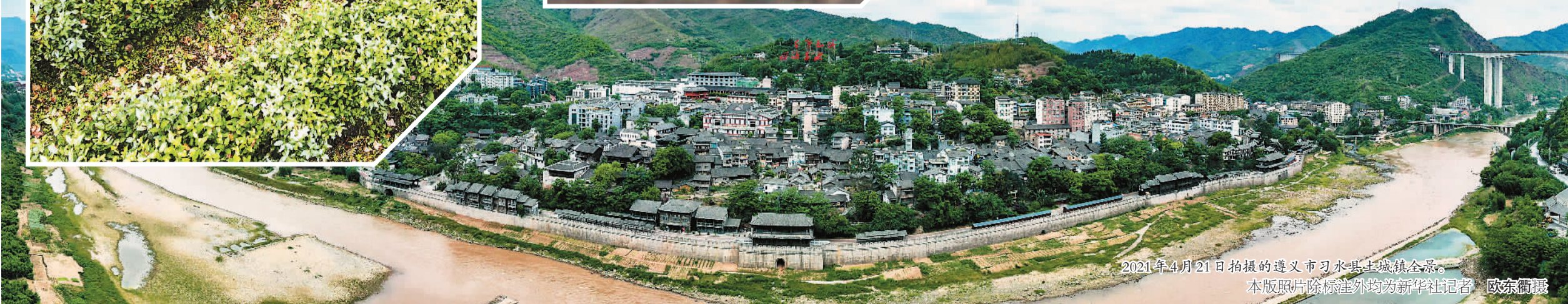
2021年4月21日拍摄的遵义市习水县土城镇全景。