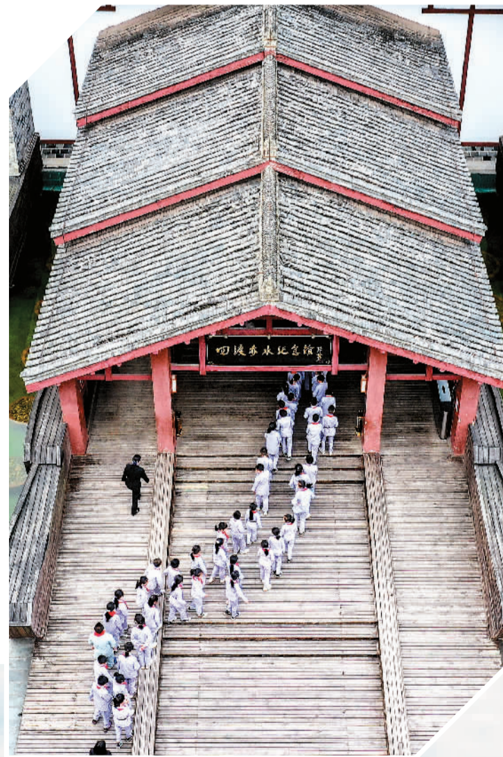
▲ 参观者进入位于遵义市习水县土城镇的四渡赤水纪念馆。