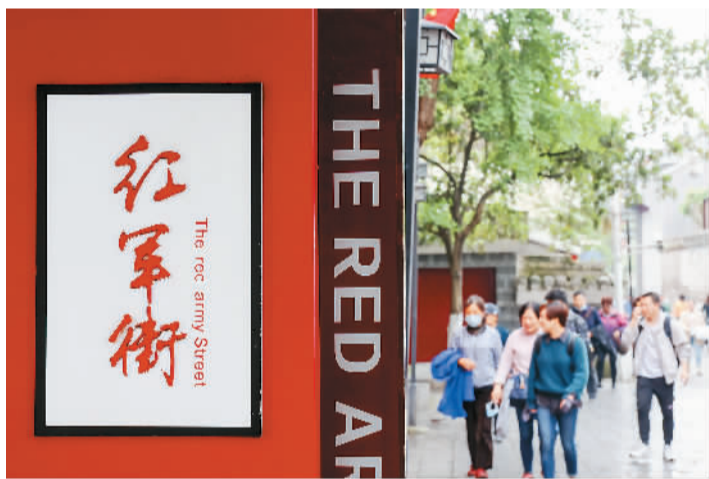
▲ 游客在遵义红军街参观游览。