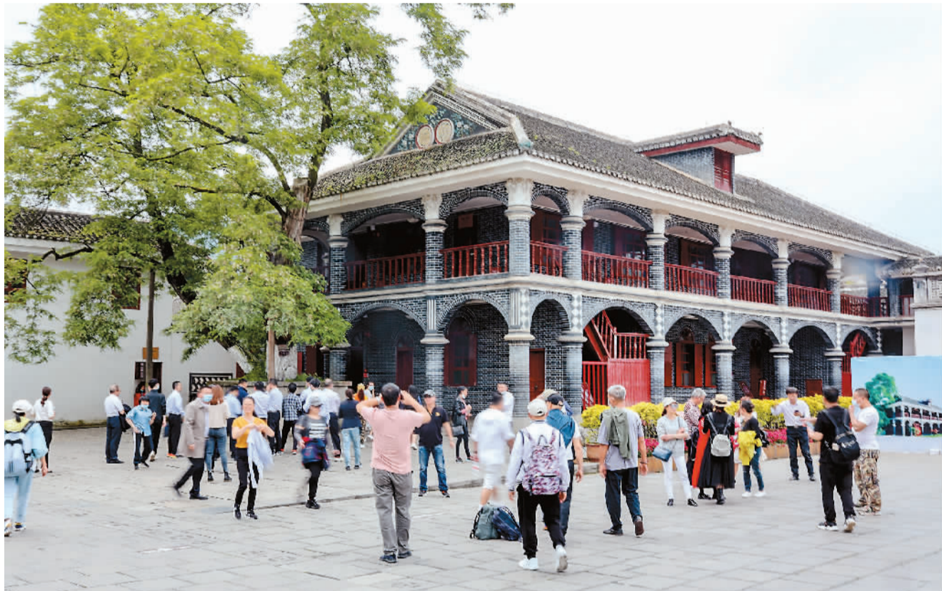
▲ 游客在遵义会议会址参观。