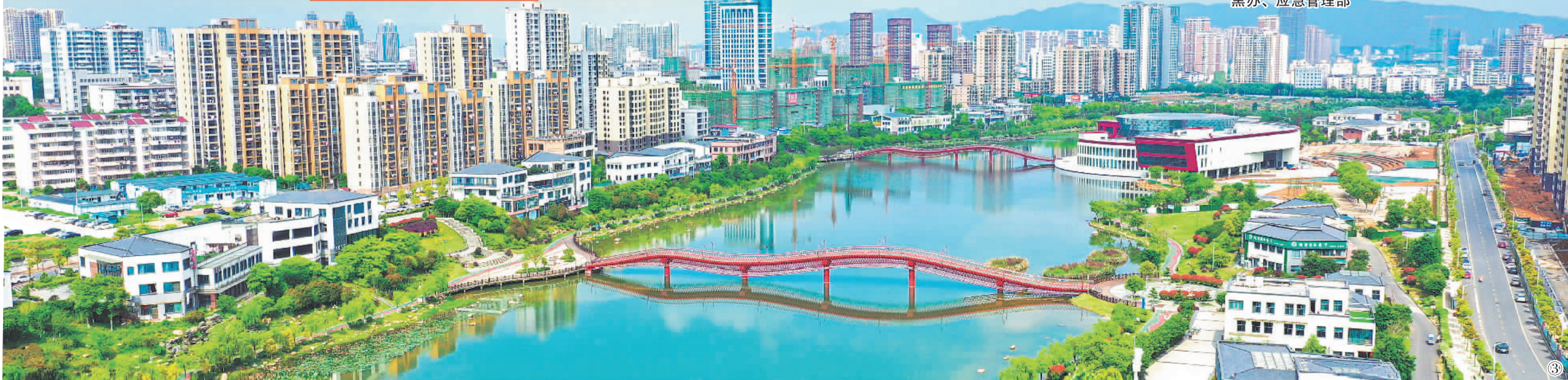
图③：江西省吉安市吉州区古后河绿廊竹山里段风光。