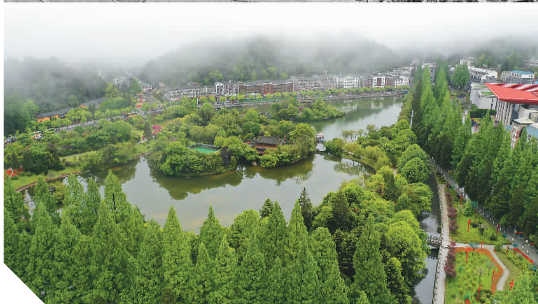
上世纪50年代拍摄的井冈山茨坪(资料照片)与2021年4月27日拍摄的茨坪今昔对比。

巍巍井冈，群峦叠翠。这里是中国革命的摇篮、著名的革命老区，但也曾是山高路陡、交通不便的贫瘠山区。1927年，中国共产党人在井冈山创建了第一个农村革命根据地，成为中国革命走向胜利的光辉起点。