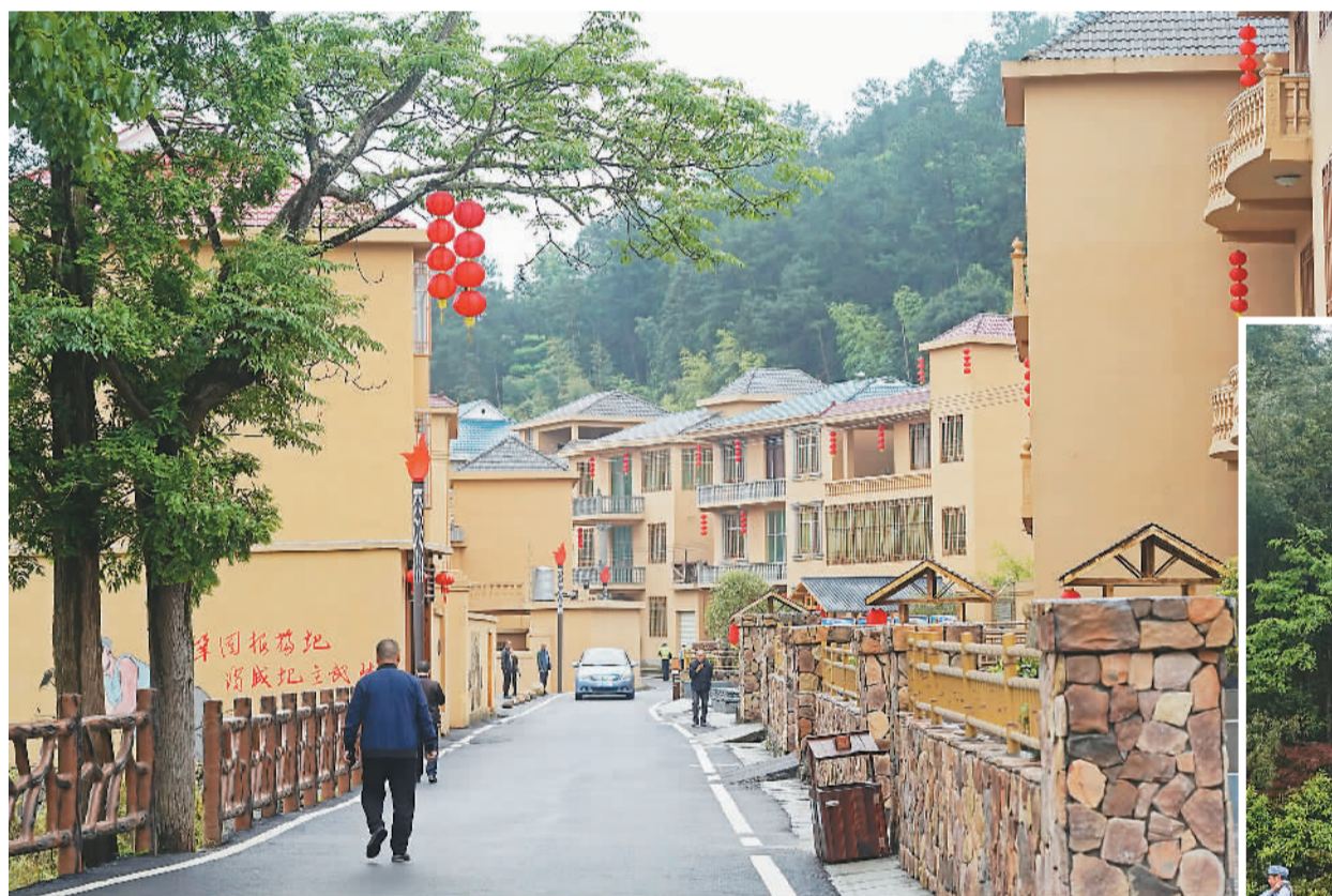
游客在位于井冈山市古田村的研学基地游览。

2017年2月，井冈山市正式宣布在全国率先脱贫摘帽，成为我国贫困退出机制建立后首个脱贫摘帽的贫困县。“红色最红、绿色最绿、脱贫最好。”今日井冈山，随处可见这样的标语。这是老百姓对美好生活的憧憬，也是井冈山因地制宜探索出的高质量发展之路。