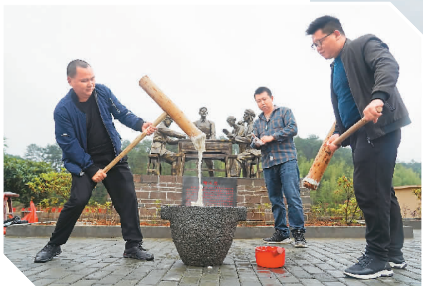
在井冈山市古田村，村民在打糍把招待游客。