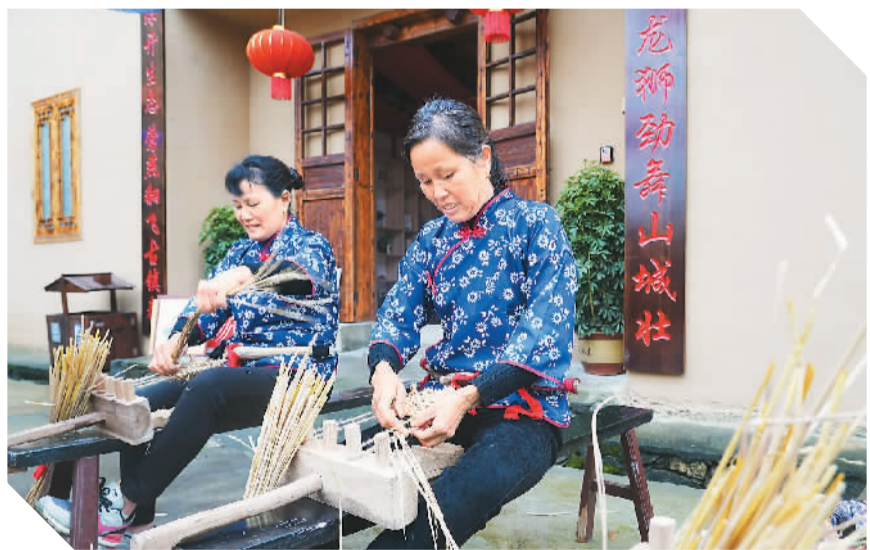
在井冈山市古田村，村民在编草鞋纪念品。