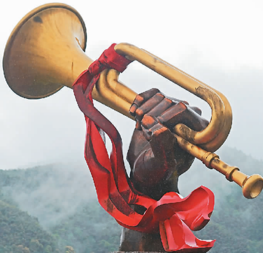
游客在井冈山参观“胜利的号角”雕塑。