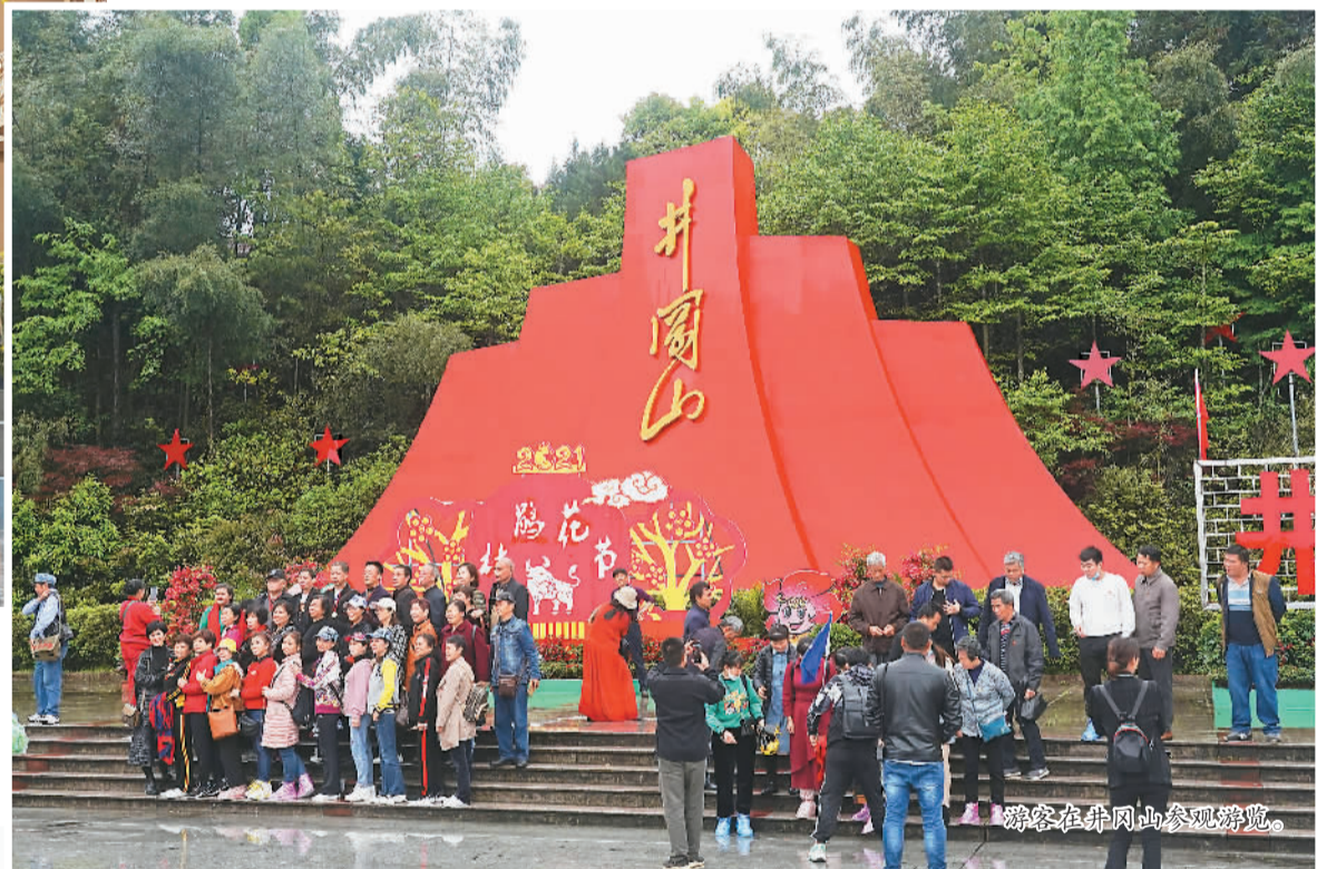
游客在井冈山参观游览。