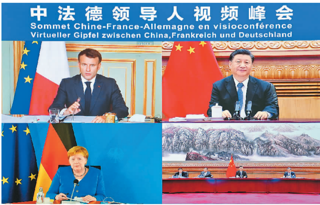
7月5日晚,国家主席习近平在北京同法国总统马克龙、德国总理默克尔举行视频峰会。