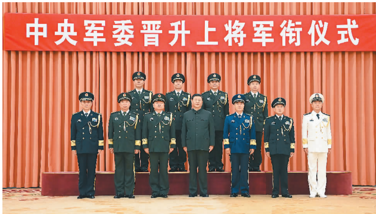
7月5日,中央军委晋升上将军衔仪式在北京八一大楼隆重举行。中央军委主席习近平向晋升上将军衔的军官颁发命令状。图为习近平等领导同志同晋升上将军衔的军官合影。