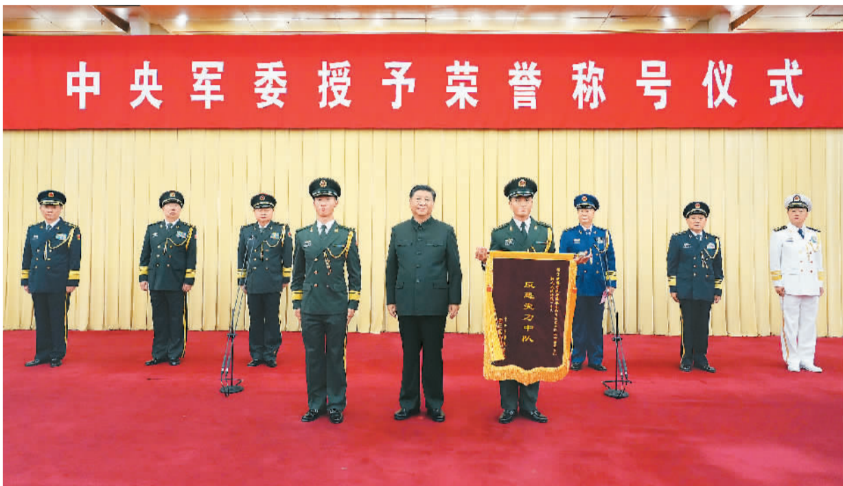
7月5日,中央军委授予荣誉称号仪式在北京隆重举行。中央军委主席习近平向获得“反恐尖刀中队”荣誉称号的武警部队新疆维吾尔自治区总队某部特战一中队代表颁发奖旗,并同该中队代表合影留念。

签署命令授予武警部队新疆维吾尔自治区总队某部特战一中队荣誉称号 签署通令给2个单位、4名个人记功