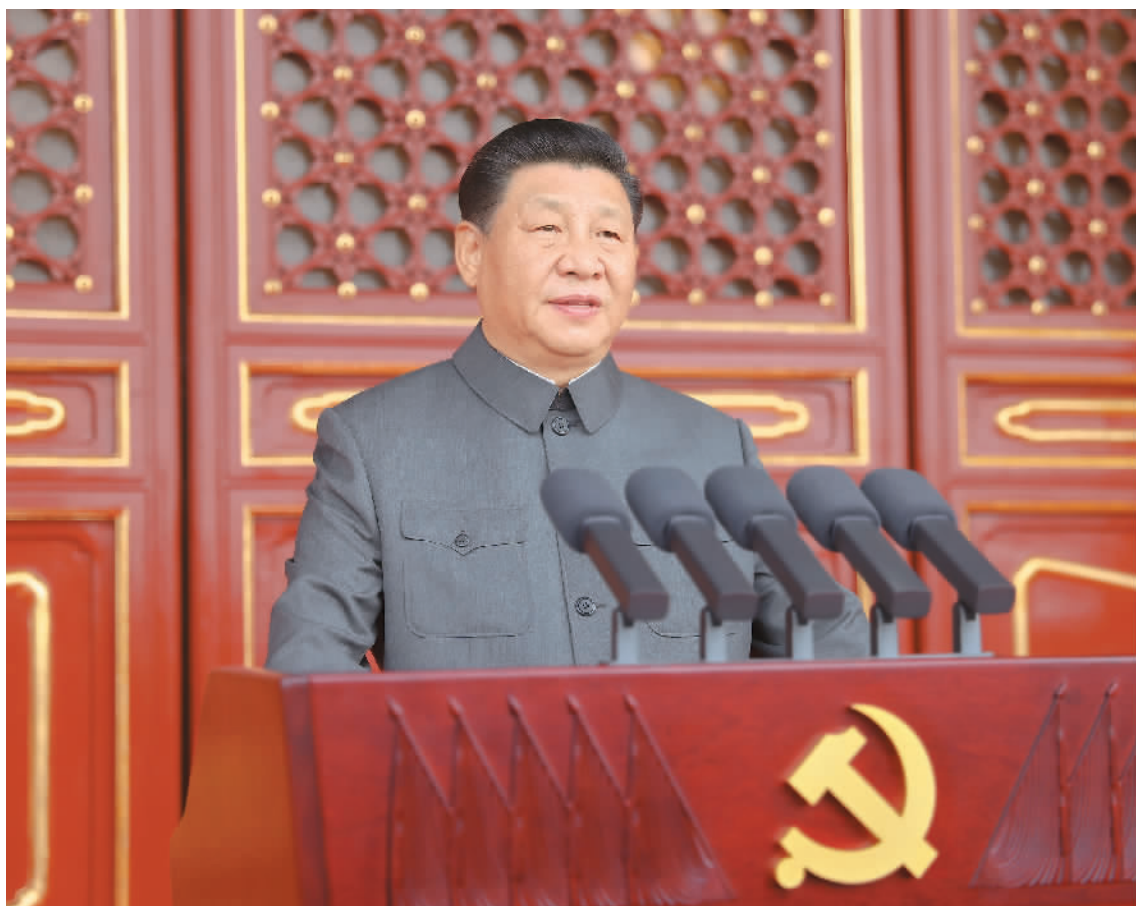
7月1日,庆祝中国共产党成立100周年大会在北京天安门广场隆重举行。中共中央总书记、国家主席、中央军委主席习近平发表重要讲话。