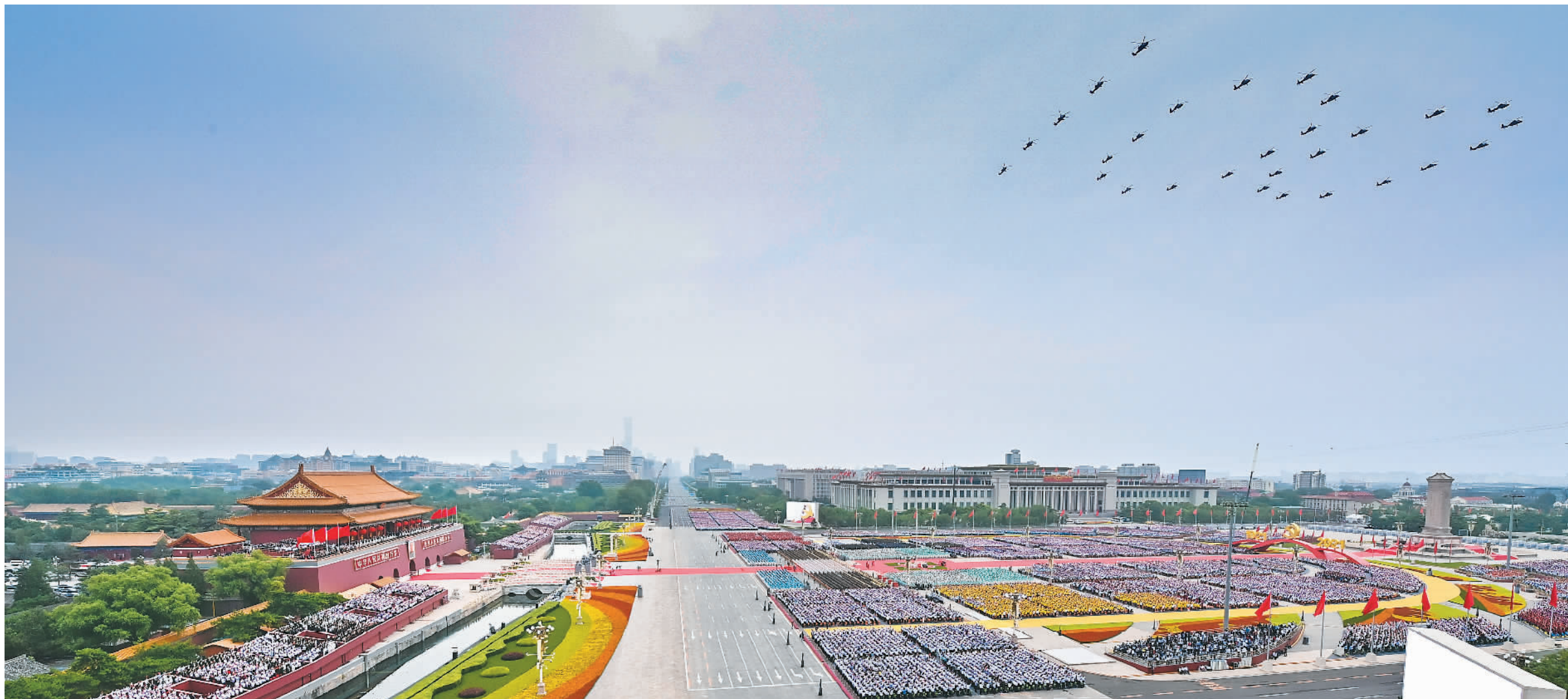
七月一日,庆祝中国共产党成立一百周年大会在北京天安门广场隆重举行。

上午7时53分,在欢快的乐曲声中,习近平等党和国家领导人来到天安门城楼主席台,全场爆发出热烈掌声。 (下转第四版)