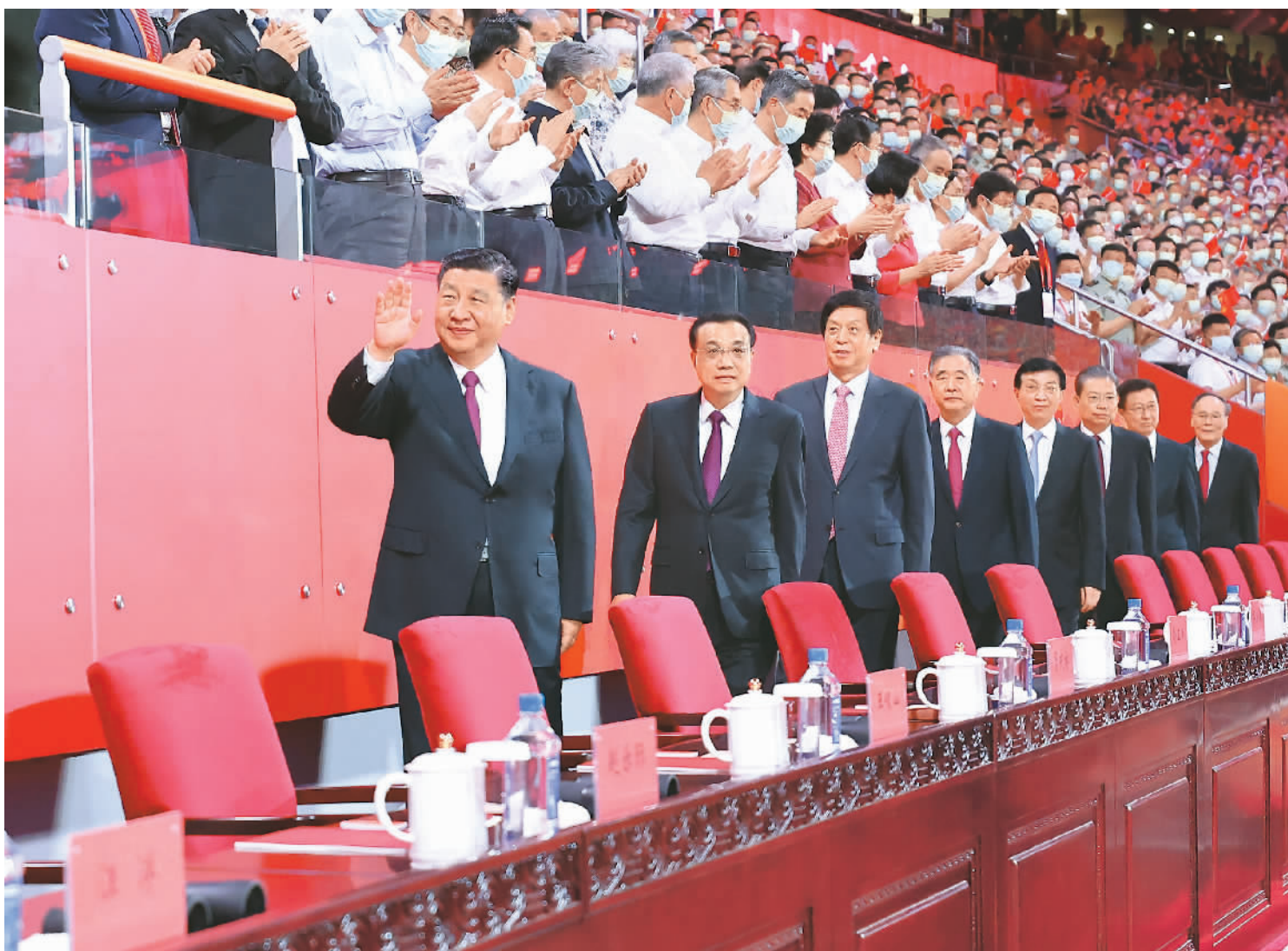
6月28日晚,庆祝中国共产党成立100周年文艺演出《伟大征程》在国家体育场盛大举行。习近平、李克强、栗战书、汪洋、王沪宁、赵乐际、韩正、王岐山等党和国家领导人,同约2万名观众一起观看演出。

“这个政党一定能指引中国走向光明,让中国人过上好日子……”戏剧与舞蹈《破晓》再现了近代以后,中华民族饱经磨难,无数仁人志士前赴后继寻找救国救民真理,直到1921年中国共产党诞生,中国革命的面貌焕然一新。第一篇章“浴火前行”,以情景舞蹈《起义》、歌舞《土地》、戏剧与舞蹈《长征》、情景大合唱《怒吼吧 黄河》、合唱与舞蹈《向前向前 向前》等节目,生动展现在大革命的烽烟中,在艰险的长征路上,在抗日战争、解放战