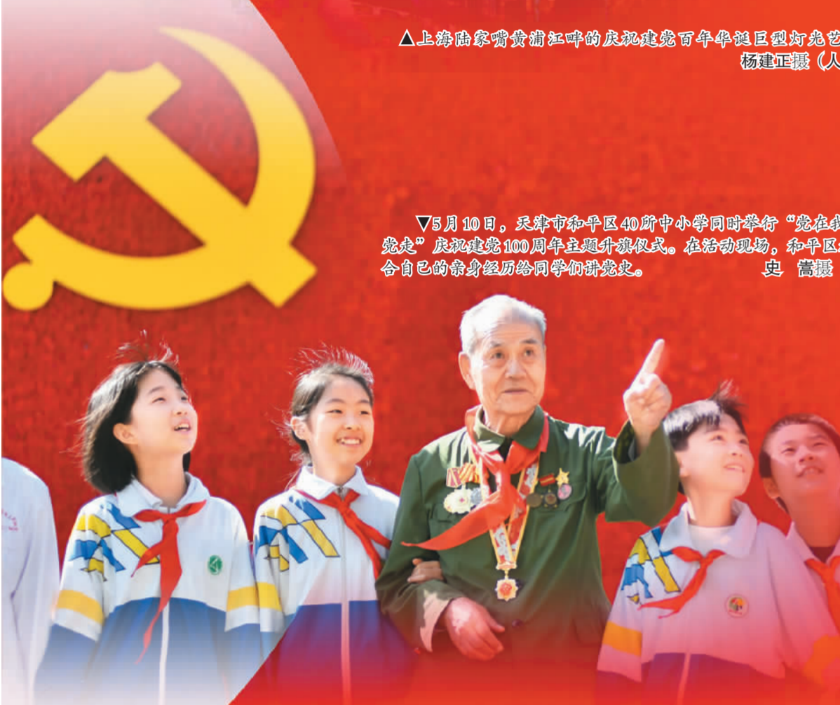
▲5月30日，天津市和平区40所中小学同时举行“党在我心中 永远跟党走”庆祝建党100周年主题升旗仪式。在启动仪式中，和平区桂园里小学的学生们将自己的亲身经历分享给同学们。