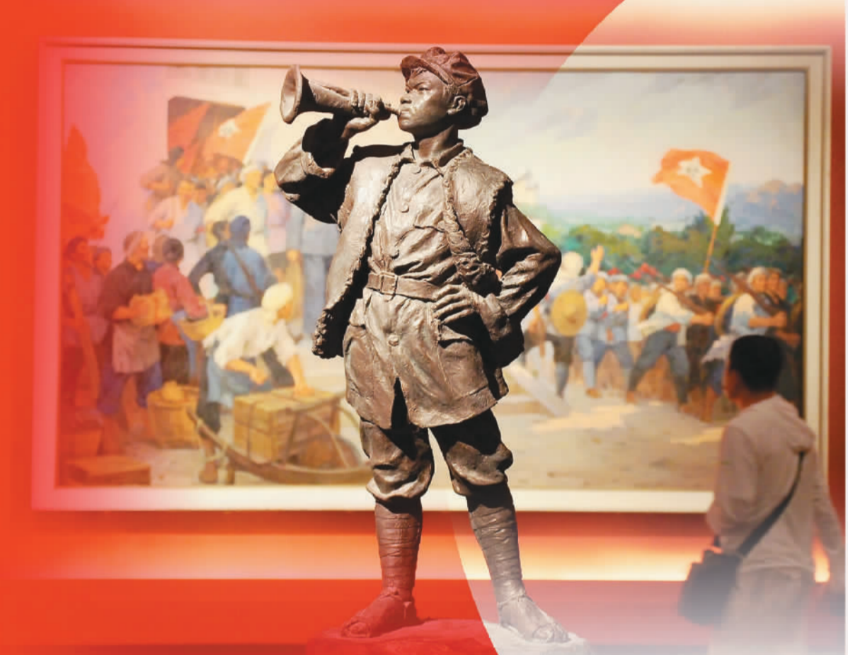
▲4月22日，《长沙特等双中供——英雄烈士中的烈士追思》在中园国际博物馆开展。