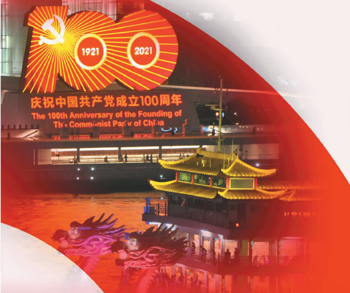
▲上海南京路外滩江中的庆祝建党百年华诞巨型灯景点亮夜色。

近年来，在同步小康驻村工作组的帮扶下，石龙村从党支部建设抓起，在夯实基层党建的基础上，带领农户推进调整农业产业结构，先后发展了石龙冲蜂蜜、脆脆心甜柿、林下生态土鸡养殖等项目。2020年初，驻村工作组在走访中发现，红军长征时，一支队伍曾经经过石龙村，与当地少数民族群众