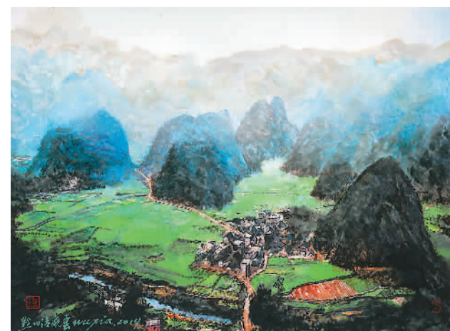
▲ 黔山清晓云(水彩) 巫峡