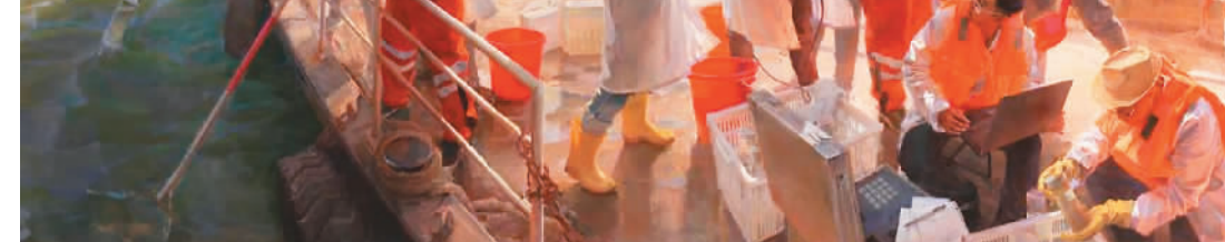
▲ 最美太湖水(油画) 商亚东

据悉，展览期间将组织开展形式多样的公共教育活动，通过这些优秀美术作品，让观众更加了解党史、新中国史、改革开放史、社会主义发展史，发挥美术作品以美育人、以美化人的独特作用。