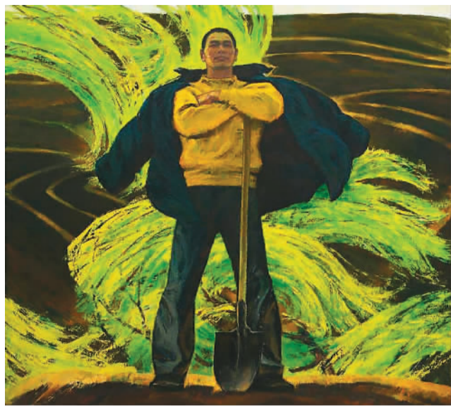
▲ 潮(油画) 詹建俊