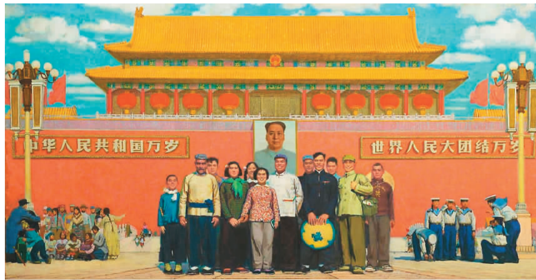
▲ 天安门前(油画) 孙滋溪