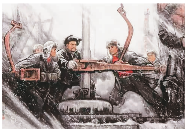
▲ 大庆工人无冬天(中国画) 赵志田