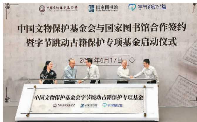
中国文物保护基金会“字节跳动古籍保护专项基金”启动

本报电(小章)6月17日, 《中国文物保护基金会与国家图书馆(国家古籍保护中心)古籍保护公益项目战略合作框架协议》在国图签约。中国文物保护基金会将发挥公益基金募集与管理优势, 为古籍保护项目提供资金和管理资源; 国图将发挥组织开展全国古籍保护工作的专业优势, 协调行业资源及专家, 推进古籍原生性和再生性保护。