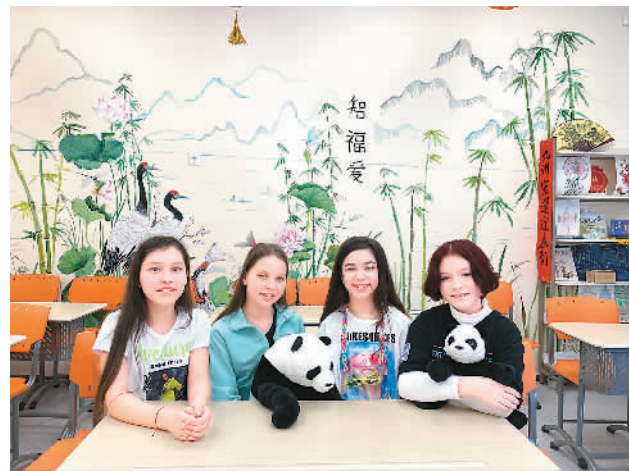
来自俄罗斯喀山183中学六年级的几位小姑娘给自己的组合起了个可爱的名字——“宝宝组合”。图为接受采访的4位参赛者。