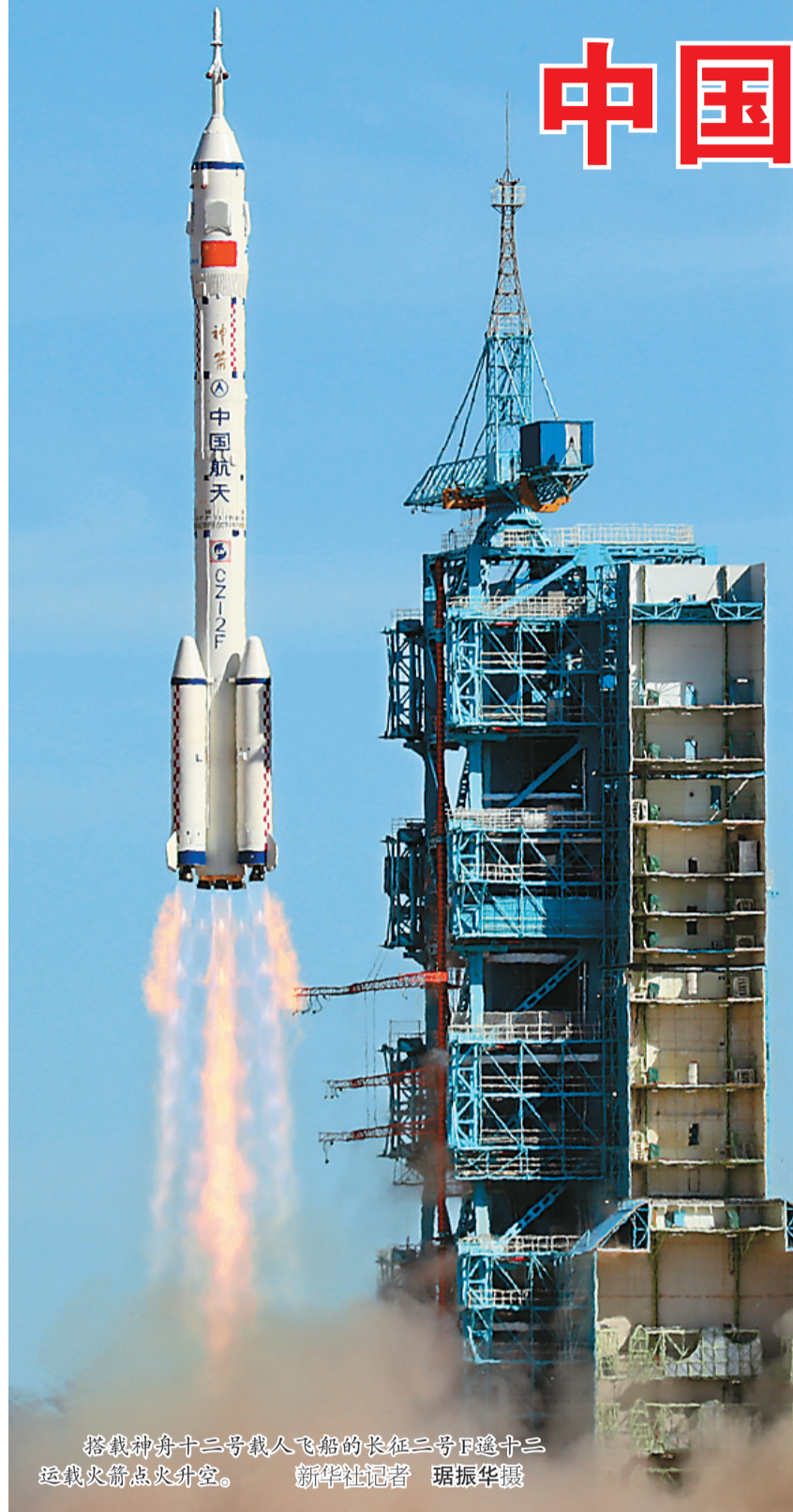
搭载神舟十二号载人飞船的长征二号F遥十二运载火箭点火升空。