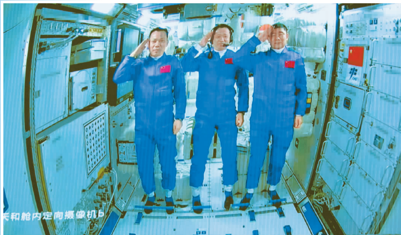
天和舱内定向摄像机B