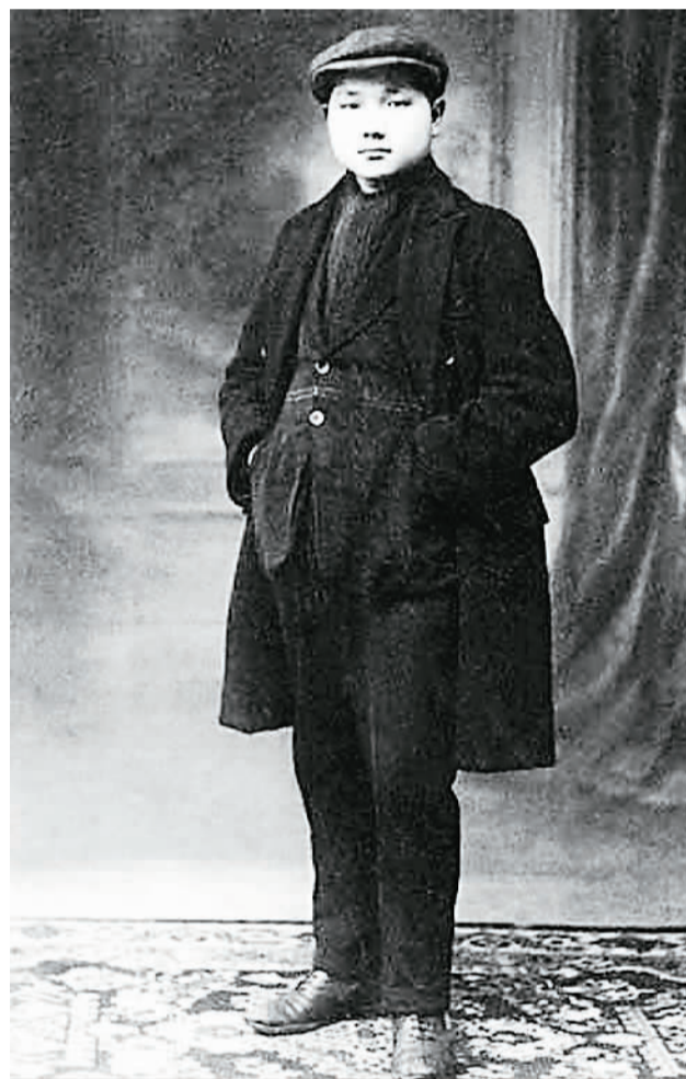
邓小平留法时留影。

位于广州市越秀区越华路116号的杨匏安旧居陈列馆(杨家祠)内，有一件写着《通告第62号》的文物复制件，内容是动员中共各级党组织积极为黄埔军校招生。为何这件文物会在一位革命者的旧居陈列馆中出现？