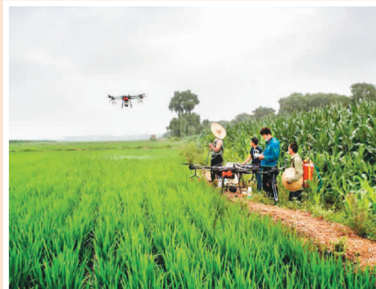
▲ 俺们村有了新“农具” 辽宁铁岭 2019年 ▲ 国产“海鸥”双反相机拍摄全家福 1984年