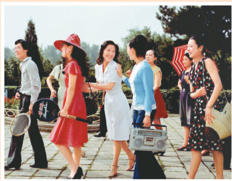
▲ 年轻一代 辽宁鞍山 20世纪80年代