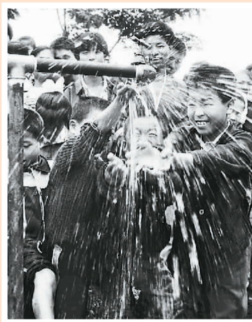
▲ 自来水来了 江西宜春 1993年