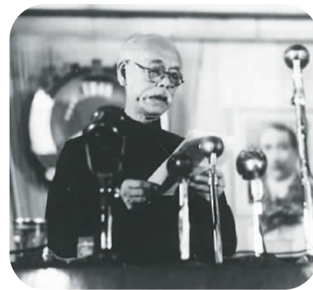
图为1949年，彭泽民在中国人民政治协商会议第一届全体会议上发言。