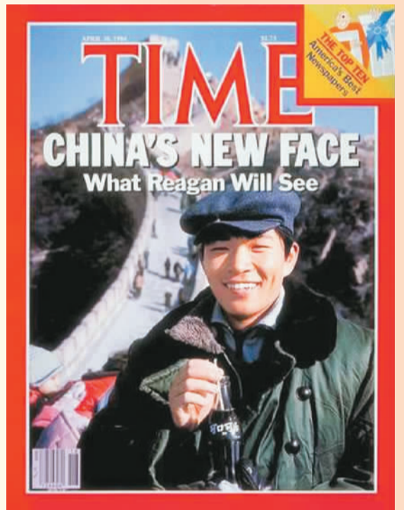
1984年4月30日的《时代》周刊封面，一个普通中国人手拿可口可乐。标题为“中国的新面貌，里根将会看到什么？”