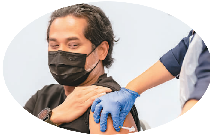
马来西亚科学、工艺和创新部长哈里·贾迈勒丁在森美兰州林茂地区一家医院接种科兴新冠疫苗的资料照片。