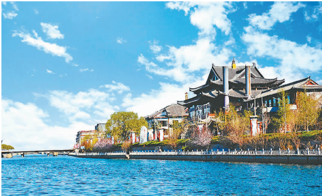
如今,高碑店乡已成为文化创意产业园聚集地。图为通惠河畔文化创意产业园,多家从事教育信息化的企业落户于此。

“夕(b)、女(p)、冂(m)、匚(f),这些拼音就是我在识字班学的。”85岁的周振兴戴上老花镜,仔细摩挲着记者递给他的人人民日报报纸。