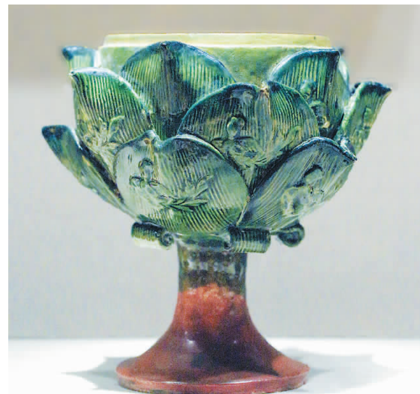
晚唐—五代邛窑黄绿釉高足瓷炉

宋代成都是西南地区最大的商品集散地，世界上最早的纸币“交子”就诞生于此。伴随着经济繁荣，市民生活也更加多姿多彩。成都出土的宋代文物种类繁多，其中不少与下棋、