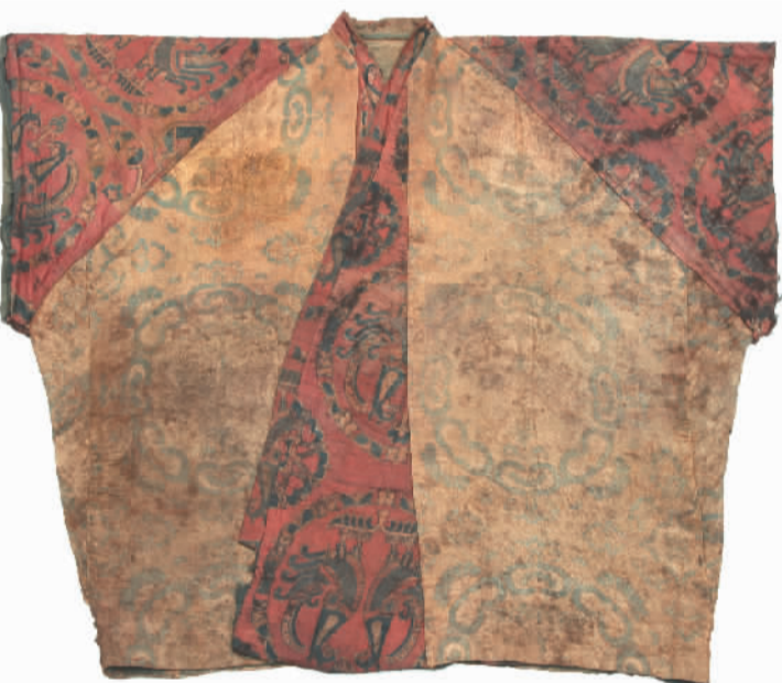
唐团窠对兽纹夹联珠对鸟纹半臂

成都曾家包汉墓出土的两幅庄园生产、生活画像石，真实再现了东汉时期成都平原沃野千里，豪强大族庄