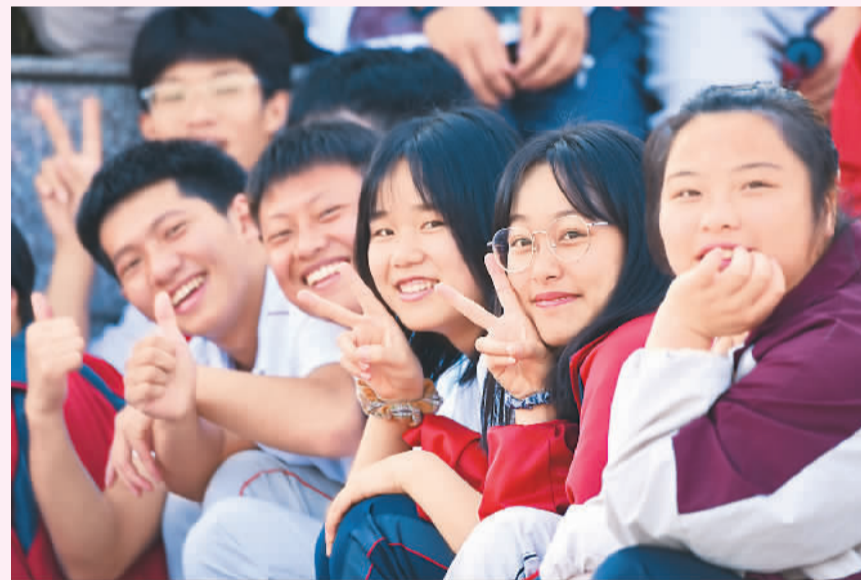
▲ 6月7日，在贵州省铜仁市松桃苗族自治县民族中学考点，考生放松心情迎考。