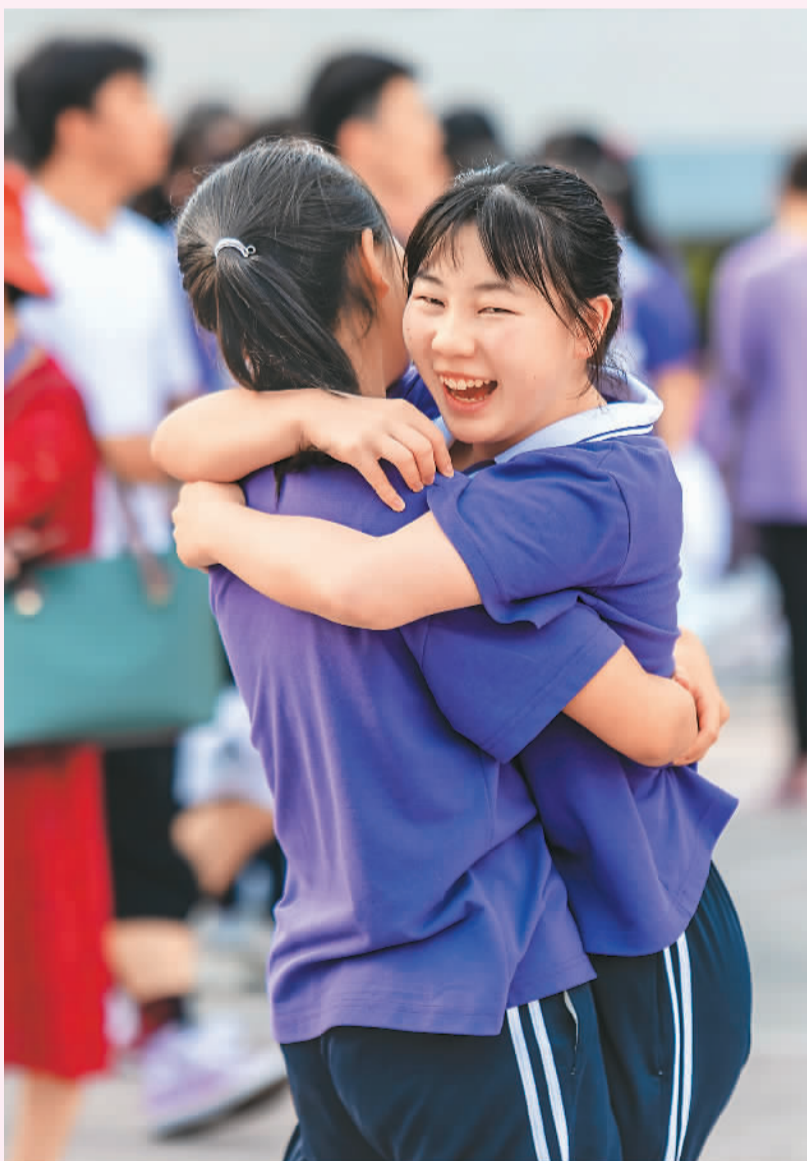
▲ 6月7日，在湖北省宜昌市秭归县一中考点，两名女生相拥加油鼓劲。

6月7日，2021年高考拉开帷幕。全国1078万考生赶赴考场，迎接人生路上的一次大考。