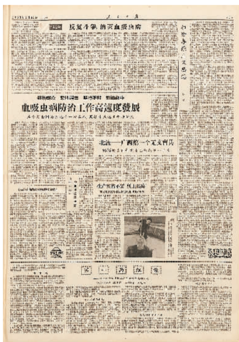
1958年6月30日出版的人民日报第七版。

作为当年“送瘟神”的血防主战场,余江蓝田早已成了“春风杨柳万千条”的美丽田园——