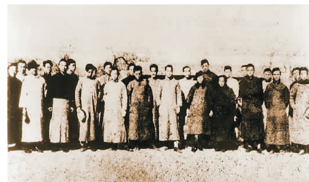
1921年, 马克思主义研究会部分会员合影。

在中青年占多数的早期中共党员眼中, 杨明斋深得敬重。周恩来曾在回忆党的历史时, 尊称杨明斋为“忠厚长者”。