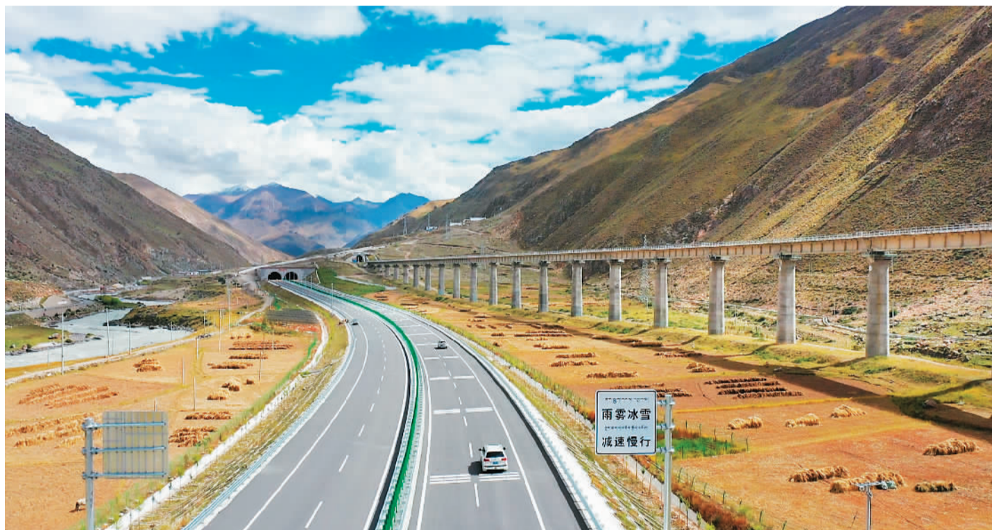
G6京藏高速羊八井至拉萨段。