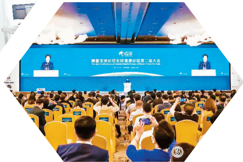
图②：博览会上，与会者在体验“华佗智慧中医”诊疗系统。 图③：博鳌亚洲论坛全球健康论坛第二届大会开幕式现场。