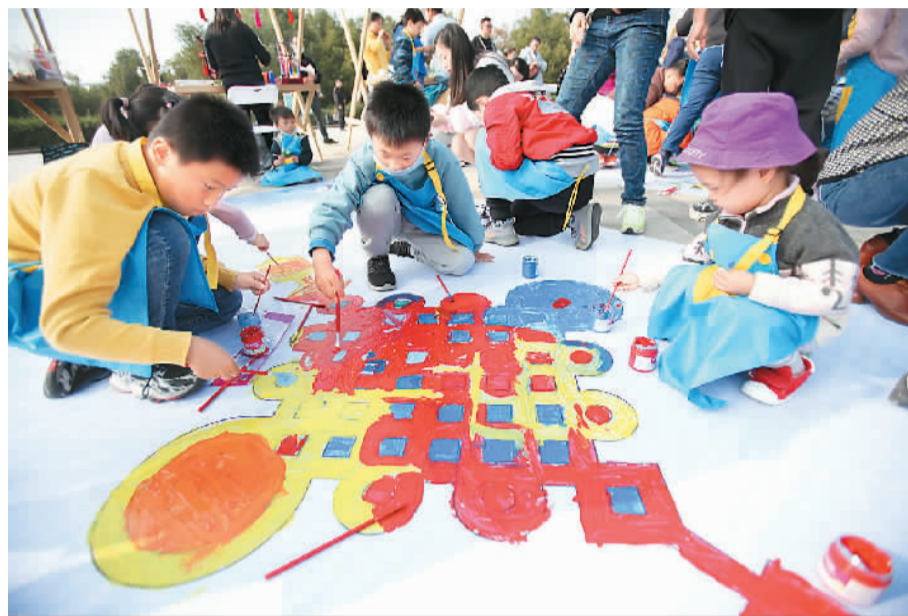
在家长的陪伴下，孩子们在南京科技馆绘制非遗画卷。

新玩法在博物馆游中也越来越普及。在一些博物馆，游客可以听到资深讲解人、知识类大赛获奖选手、或是资深导游等的讲解，还可参与博物馆线上之旅。携程发布的2021年上半年文博游大数据显示，上半年亲子家庭预订博物馆的票量相比2019年同期增长21%，