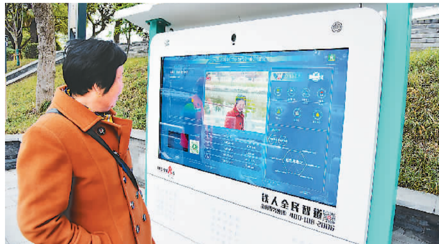
在江苏省如皋市外城河,市民正在体验健身步道智能体测一体机系统。

业内人士也指出,国家的政策引导为更好满足人们的健身需求指明了智能化发展方向。智能化探索不停步,相信未来会有更“聪明”、更“时尚”的设施、场所出现在人们的生活中,让锻炼更科学、更有趣。