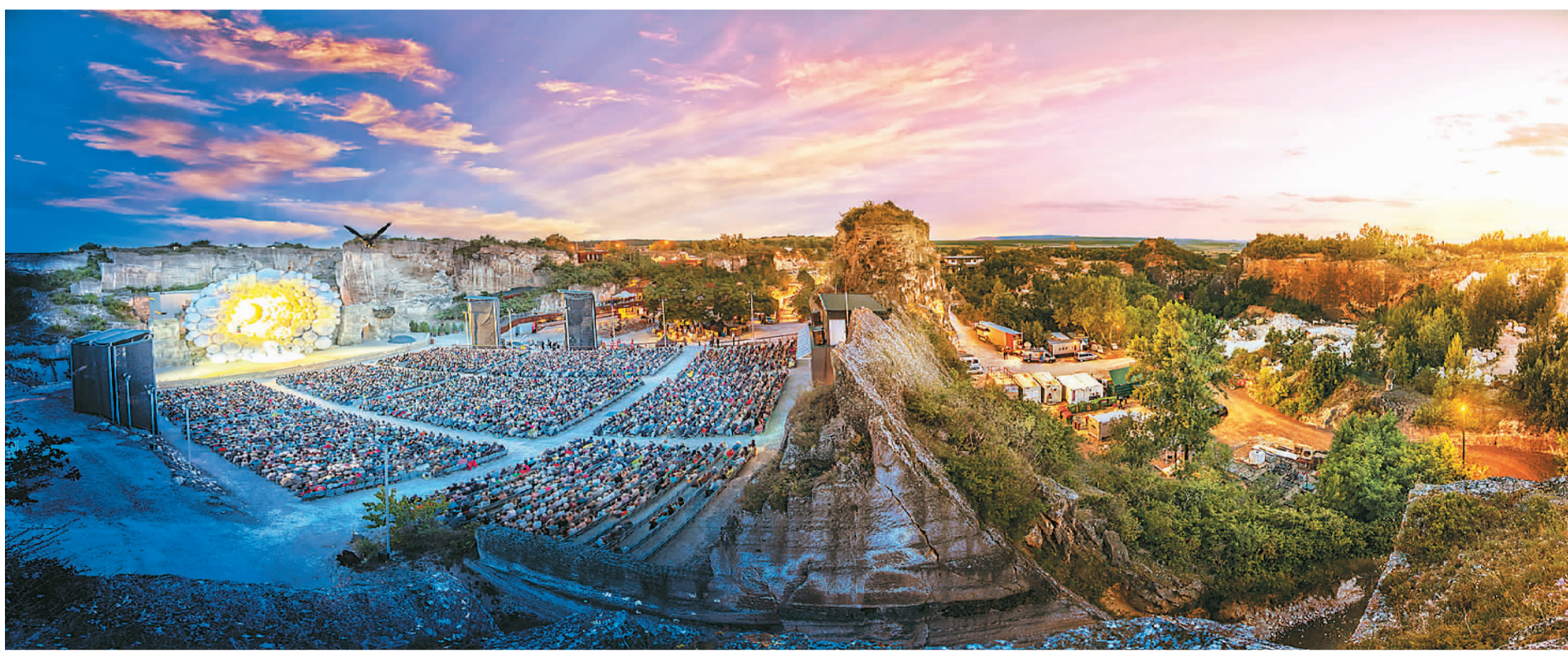
奥地利罗马采石场露天剧院位于布尔根兰州圣玛格丽滕地区。图为剧院演出时的盛况。

谈起中国文化艺术，石迪福大使打开了话匣子。大使说，最近看了一部名为《地久天长》的中国电影，影片讲述了20世纪80年代两个中国家庭的故事，让他非常感动。“这部电影获得许多奖项，每个希望了解中国的外国人，都可以看一看，相信看过的人都会热泪盈眶。”