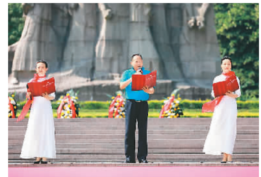
图为活动现场。（江苏侨联供图）

大会上，3名归侨侨眷代表朗诵诗歌《雨花魂》，深情追忆侨界共产党员的革命历程。中国侨联、江苏省侨联和南京市侨联还深入挖掘侨界共产党员的故事，编撰《百年风华·雨花魂》一书，并在活动现场举办赠阅仪式。同时，在与会人员的见证和参与下，“侨心向党、奋进新征程”倡议还向海内外侨胞正式发出，获得20家海外侨团、近万名海外侨胞的同步响应。（来源：江苏侨联）