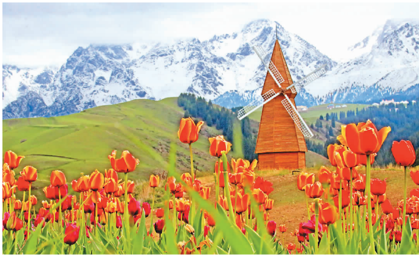
原、松林等相映成景，吸引游人前来观赏。 位于天山脚下的新疆奇台县江布拉克景区内，盛开的郁金香和雪山、草

这是在2021中国休闲度假大会上发布的《2021中国休闲度假产业发展趋势报告》中的观点。