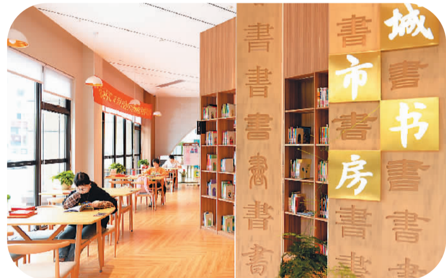
居民在浙江省湖州市南浔区幸福邻里中心城市书房阅读。

报告展望，“十四五”期间，数字文化、“互联网+旅游”、线上线下体育融合等将成为政府推动休闲度假科技化的重点领域。5G、大数据、人工智能、区块链等技术将在丰富休闲度假体验、增加休闲度假消费、提高休闲度假服务效率等方面发挥更大的作用；科技进步也将创造出更为丰富的休闲度假消费场景，提升休闲度假消费的便利性。