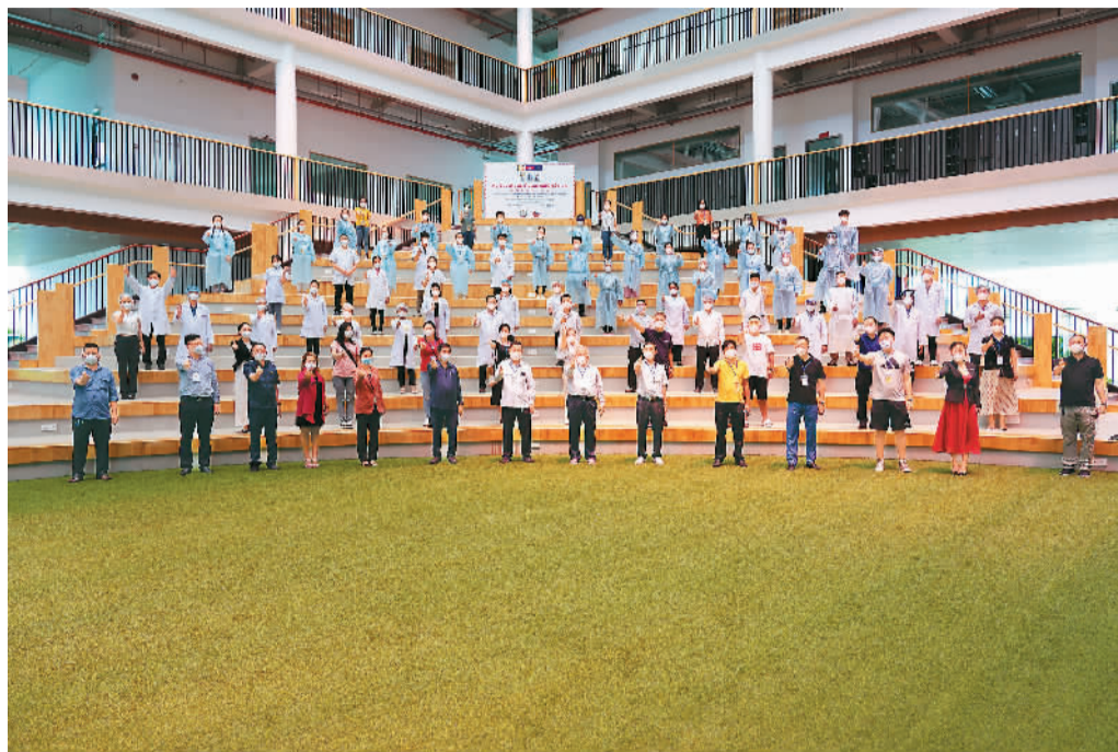
五月八日，柬埔寨华侨理事总会人士和志愿者接种疫苗后合影。

近期，东南亚多国疫情反弹。泰国、柬埔寨、马来西亚感染人数不断攀升，当地政府为遏制疫情蔓延相继出台一系列防疫措施。面对来势汹汹的疫情，东南亚华侨华人凝聚合力，共克时艰。