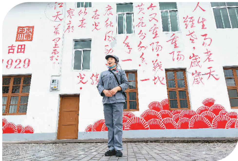
▲ 4月21日，一名讲解员在古田“红军小镇”讲解。