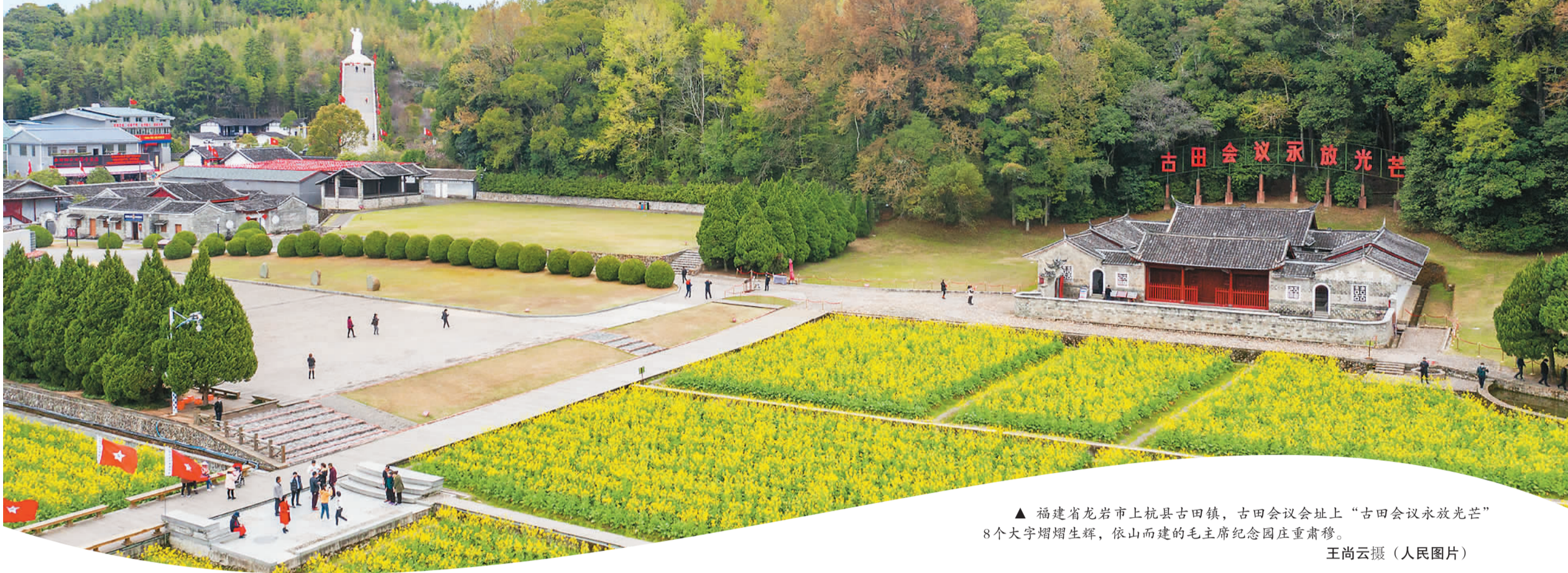
▲ 福建省龙岩市上杭县古田镇，古田会议会址上“古田会议永放光芒”8个大字熠熠生辉，依山而建的毛主席纪念园庄重肃穆。