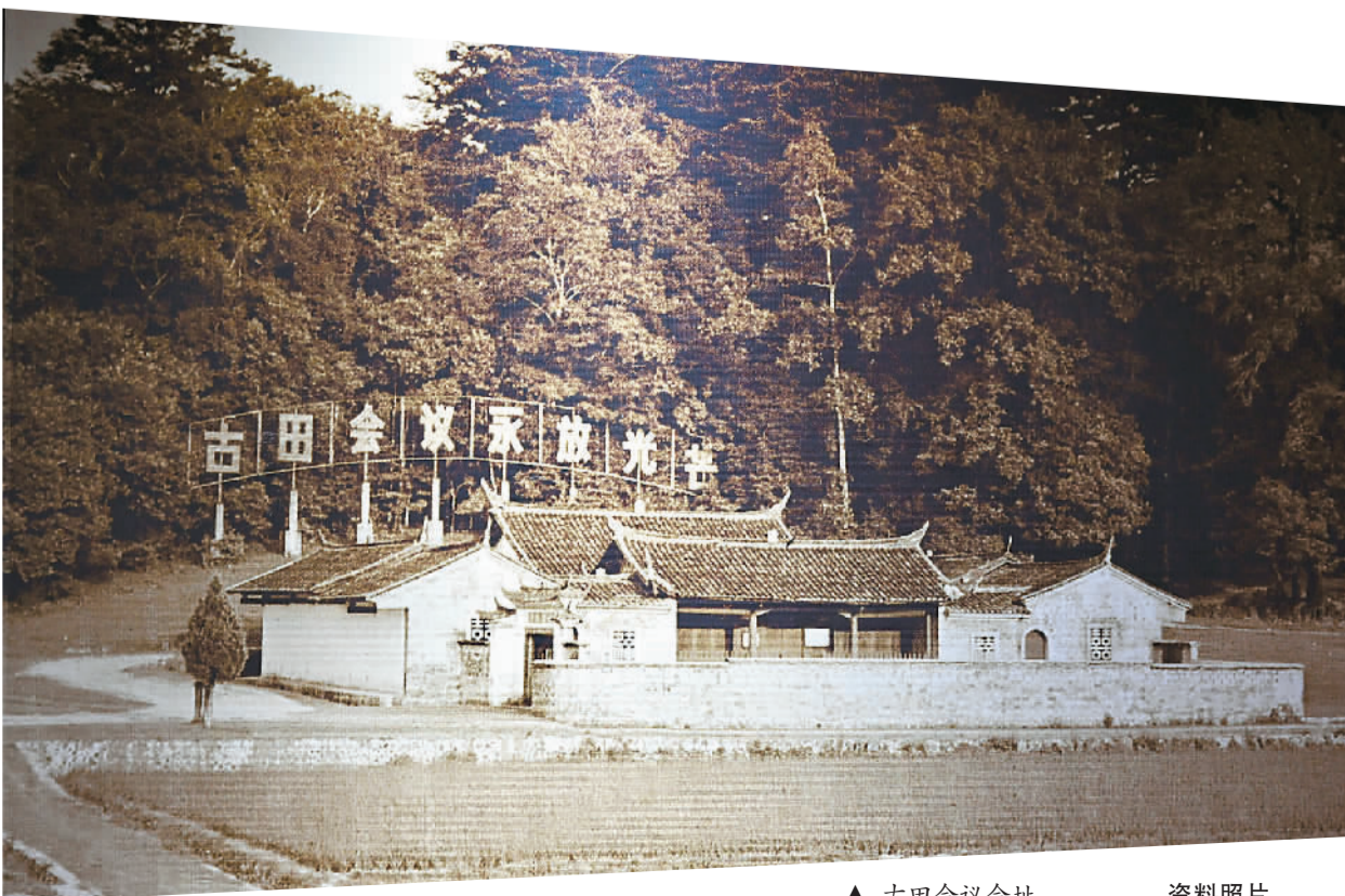
▲ 古田会议会址。 资料照片