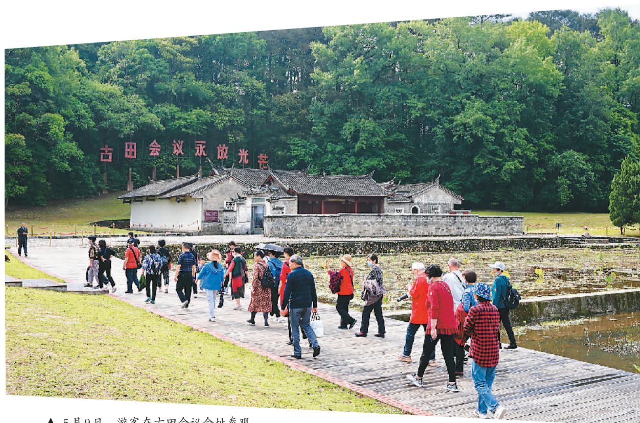
▲ 5月9日，游客在古田会议会址参观。