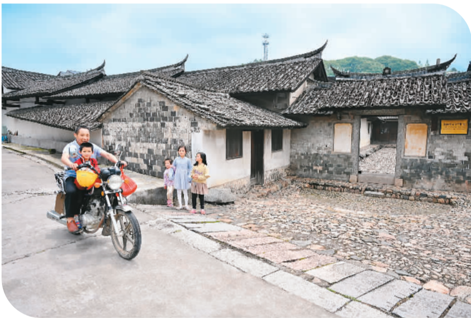
► 5月9日，居民骑车经过位于古田镇八甲村的红四军司令部旧址。

多年来，上杭县发挥红色古田的独特优势，持续加大对古田会议会址、红四军司令部旧址、毛泽东《星星之火，可以燎原》写作地旧址等革命旧址群的保护与利用，推进红色培训、红色旅游、红色研学“三红”产业发展。同时不断增强红色旅游的辐射带动作用，立足当地良好的生态环境和“村在景区中、景点在村中”的实际，发展全域旅游，推动乡村振兴。如今的古田镇“处处是景观、村村是景点”，持续发展的红色旅游让当地百姓在家门口吃上“旅游饭”，人民群众的获得感、幸福感、安全感显著提升。