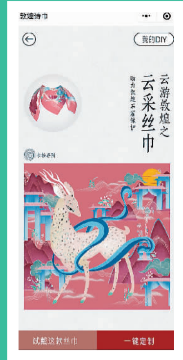
“云游敦煌”小程序 手机截图