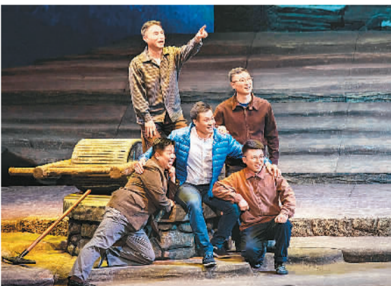
民族歌剧《马向阳下乡记》剧照

本报电（记者郑娜）5月13日、14日，“庆祝中国共产党成立100周年优秀舞台艺术作品展演”剧目民族歌剧