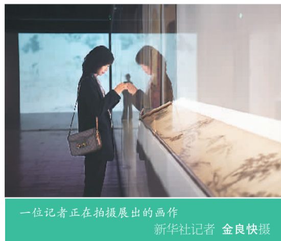
一位记者正在拍摄展出的画作