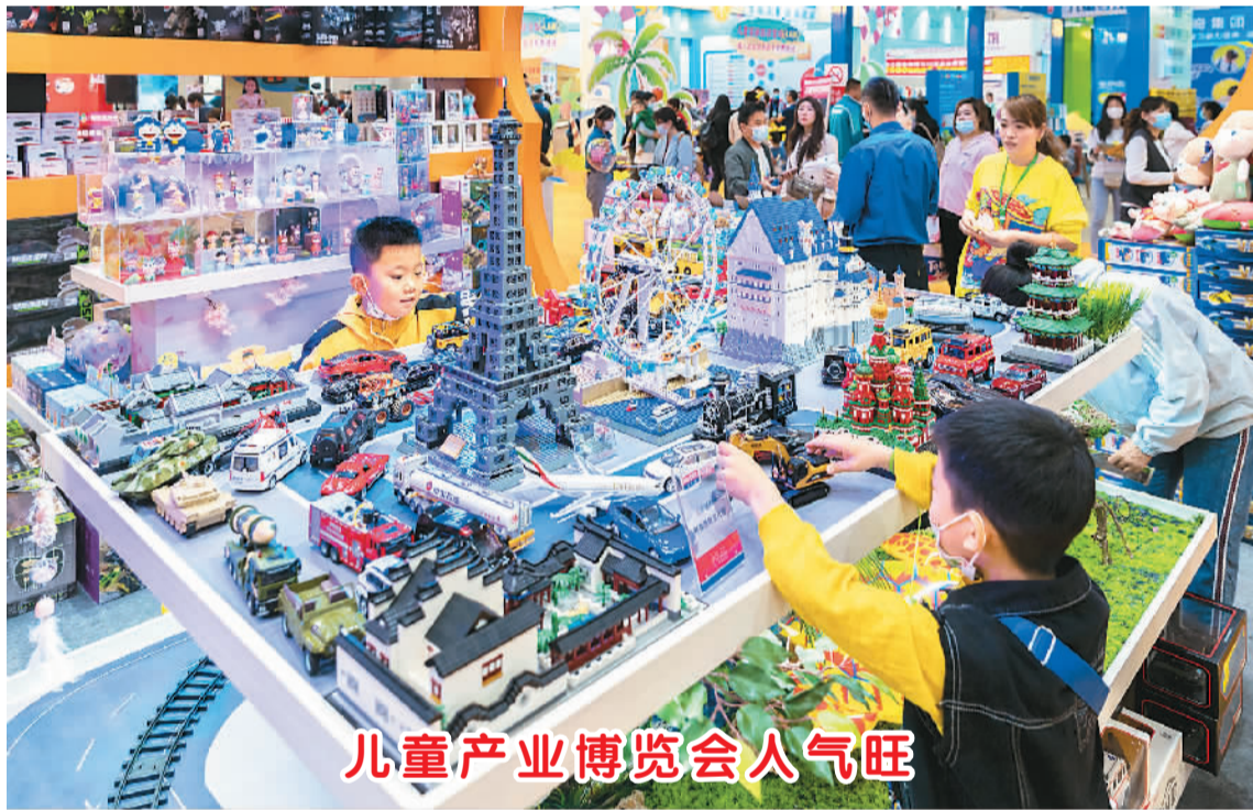
儿童产业博览会人气旺

据悉，在耕地调查基础上，发展富硒功能农业，提供富硒农产品，越来越多地方走上“硒”望之路。河北实施了《天然富硒土地判定要求》，河南出台了《富硒土壤硒含量要求》。广西提出打造“中国富硒农业之都”。江西省提出力争到2022年富硒农业基地面积达到300万亩以上，富硒农业综合产值突破600亿元。